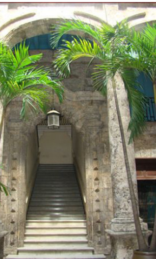
Escalera del Palacio del Segundo Cabo © Oficina del Historiador de la Ciudad de La Habana (OHCH)w

c) El contenido no tiene relación alguna con el devenir histórico del inmueble, como el Edificio de Arte Universal del Museo Nacional de Bellas Artes (La Habana, Cuba). El antiguo Centro Asturiano hoy alberga una amplia colección de piezas artísticas desde la Historia Antigua hasta la actualidad de diferentes procedencias geográficas.