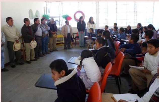
Presentación de la autoridad municipal

El día 6 de enero del presente año, el comité del museo comunitario en coordinación con la Autoridad Municipal, comité de padres de familia y maestros que laboran en la Escuela Primaria Bilingüe “Emilio Carranza”, convivieron el día de Reyes con los niños que estudian en dicho plantel.