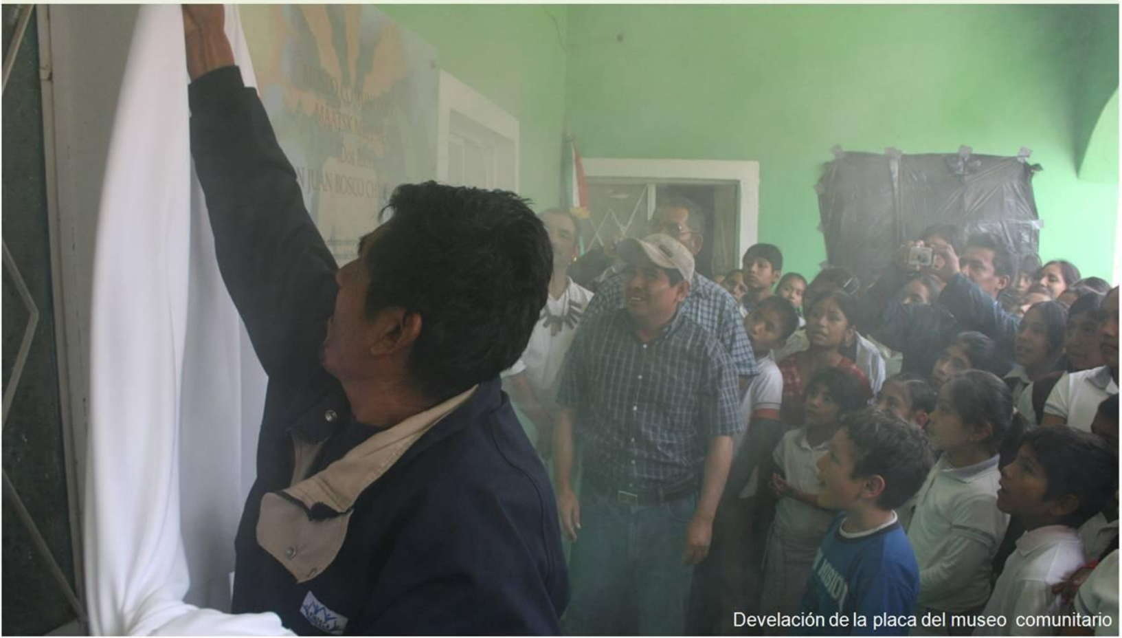
Develación de la placa del museo comunitario

El Museo Comunitario MÄÄTSK MËJY NËË (Dos Ríos), de San Juan Bosco Chuxnabán, Quetzaltepec Mixe, fue inaugurado el 17 de diciembre con la presencia de la mayor parte de la población y representantes de 12 poblaciones miembros de la Unión de Museos Comunitarios de Oaxaca, además de funcionarios de la Secretaría de Culturas y Artes de Oaxaca, la Secretaría de Asuntos Indígenas, el Instituto Nacional de Antropología e Historia, la Asociación Civil Apoyo al Desarrollo de Archivos y Bibliotecas de México y visitantes de Estados Unidos y Rusia.