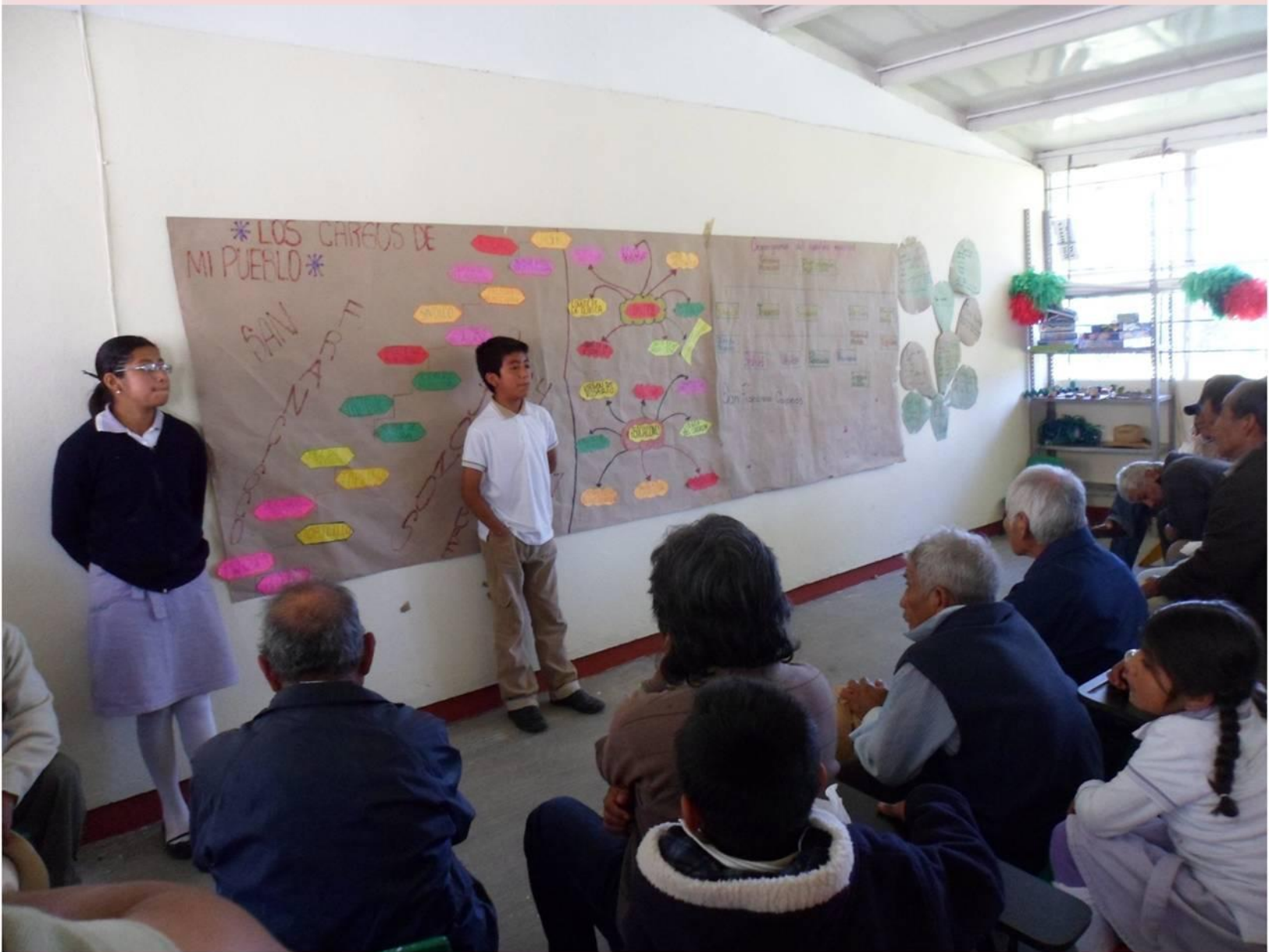
Alumnos de sexto grado exponiendo el tema: cargos municipales

La Autoridad Municipal felicitó a los niños que expusieron, a los maestros que laboran en la escuela y recalcó la importancia del museo comunitario en su proceso de aprendizaje al revitalizar el sistema de organización, las tradiciones, la cultura de nuestra comunidad.