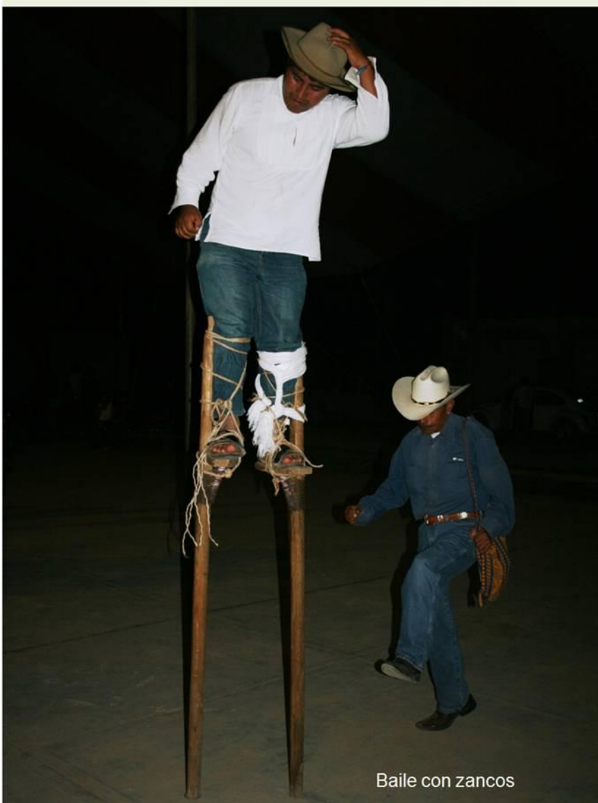
Baile con zancos