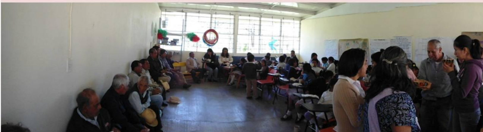
Alumnos, autoridad municipal, maestros, comité del museo y de padres de familia disfrutando de la rosca de reyes

Al inicio de la convivencia la autoridad municipal presento a cada uno de los integrantes del cabildo, quienes fueron bien recibidos por el alumnado y maestros. Posteriormente se repartió la tradicional rosca de Reyes acompañada de un delicioso chocolate.