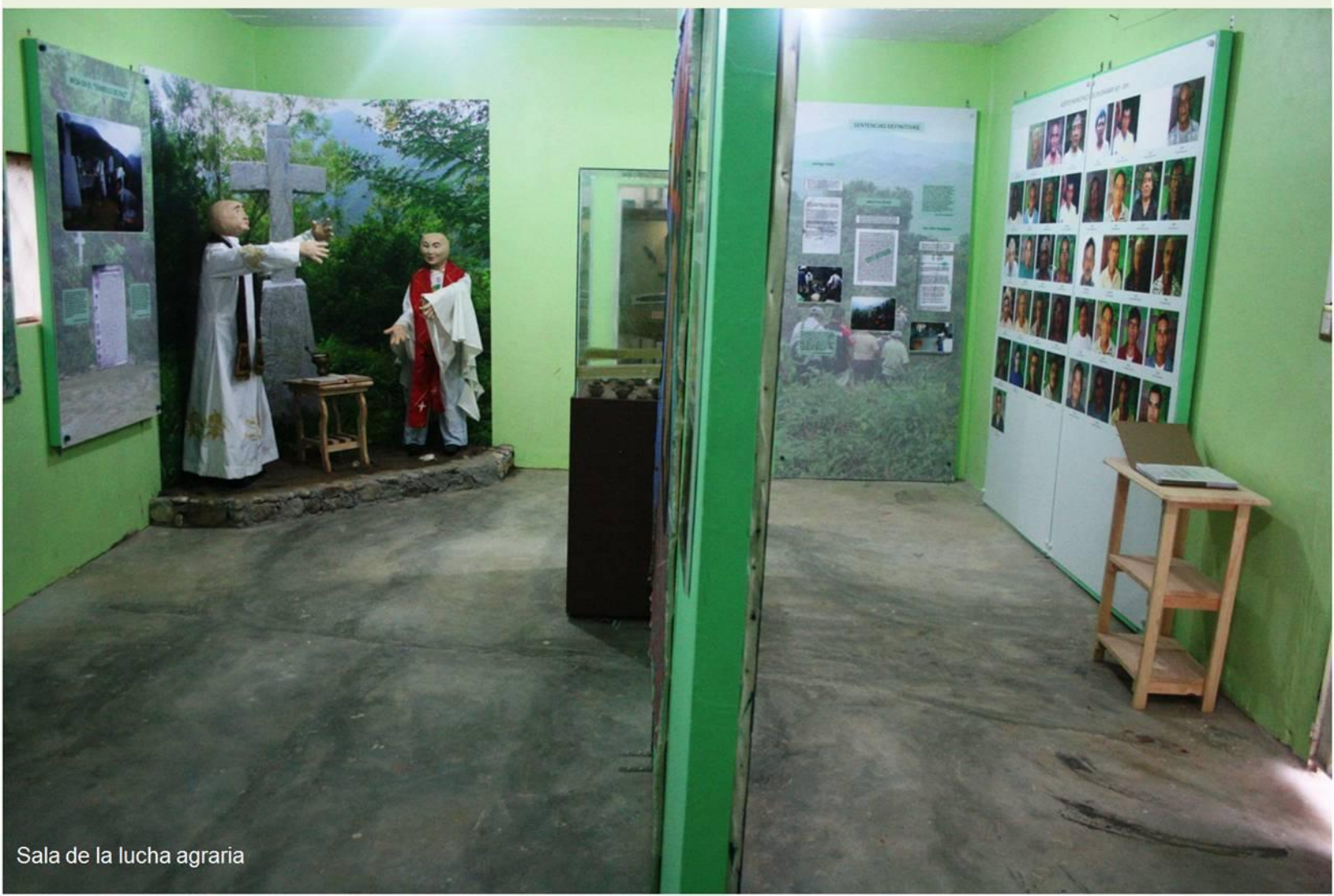
Sala de la lucha agraria

Este nuevo museo comunitario presenta dos temas, seleccionados desde 2008 en asamblea comunitaria: La Lucha Agraria y La Arqueología de San Juan Bosco Chuxnabán. La exposición “Lucha agraria y soluciones a través del diálogo independiente” muestra la manera en que la población superó la etapa de enfrentamientos con sus vecinos para avanzar en un proceso de diálogo, que desembocó en pláticas, negociaciones sobre el terreno, trabajos para abrir brechas, establecimiento de mojoneras, firma de convenios, levantamientos topográficos y finalmente firma de sentencias definitivas para solucionar los conflictos con Santa Cruz Ocotál, Santiago Atitlán y San Isidro Huayapam. El mismo proceso está por culminarse con la población de Santa María Alotepec. En la exposición la comunidad recreó una mesa de diálogo, incluyendo a cinco personas sentadas a la discusión, que representan simbólicamente a Chuxnabán y los cuatro pueblos con los que han solucionado conflictos. También recrearon una escena en donde se celebró una misa en la mojonera “Símbolo de Paz”, misa con la participación de los dos curas de Chuxnabán y Santa Cruz Ocotál, un acto simbólico que consolidó sus relaciones pacíficas.