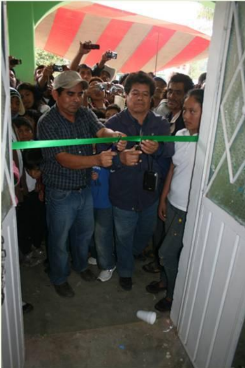
Corte de listón

El Museo Comunitario MÄÄTSK MËJY NËË (Dos Ríos), de San Juan Bosco Chuxnabán, Quetzaltepec Mixe, fue inaugurado el 17 de diciembre con la presencia de la mayor parte de la población y representantes de 12 poblaciones miembros de la Unión de Museos Comunitarios de Oaxaca, además de funcionarios de la Secretaría de Culturas y Artes de Oaxaca, la Secretaría de Asuntos Indígenas, el Instituto Nacional de Antropología e Historia, la Asociación Civil Apoyo al Desarrollo de Archivos y Bibliotecas de México y visitantes de Estados Unidos y Rusia.