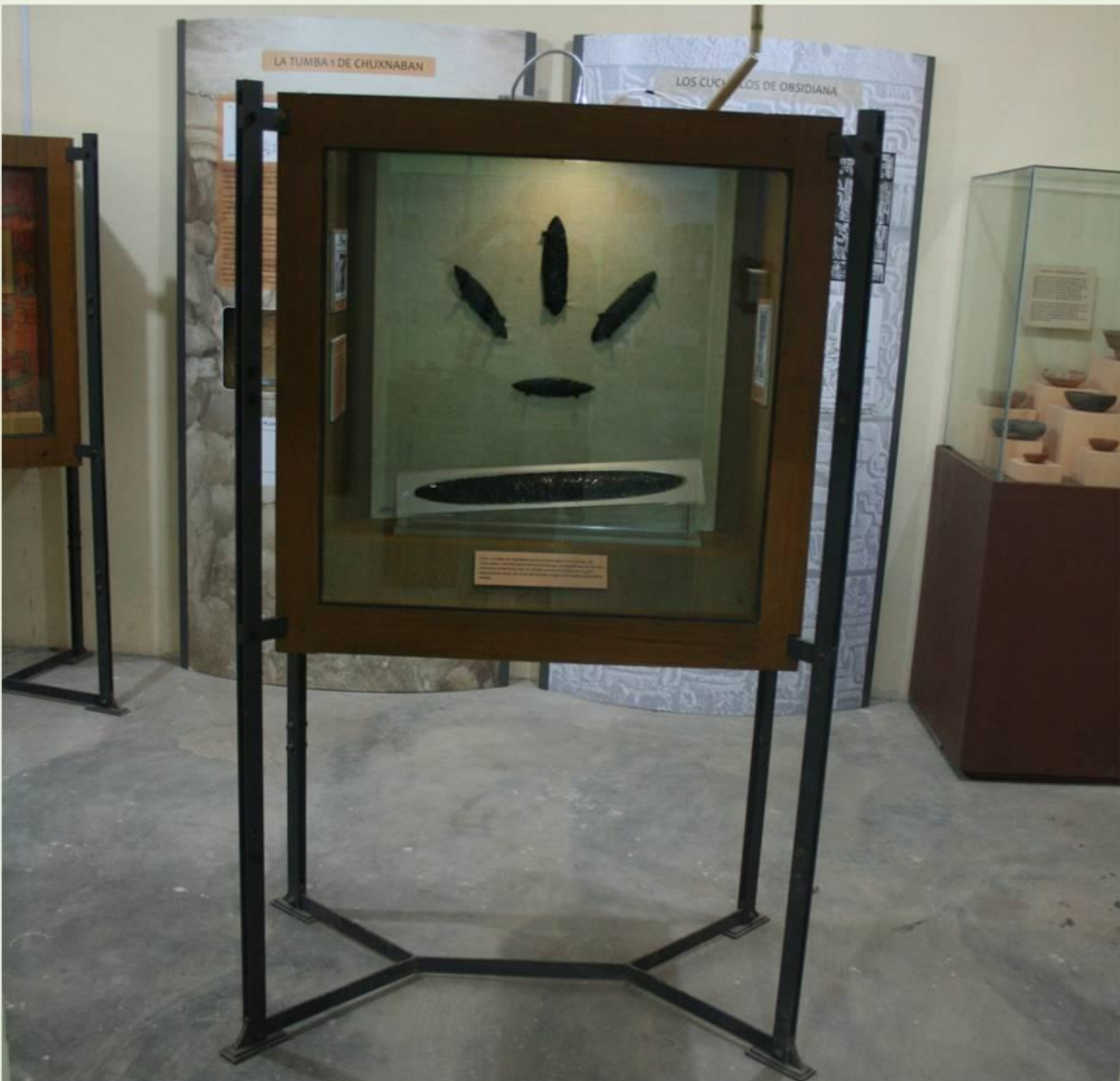
Sala de arqueología (cuchillos de obsidiana)

La exposición de la arqueología de Chuxnabán muestra los hallazgos de la Tumba Número 1, descubierto por jóvenes de la comunidad y posteriormente explorada por arqueólogos del INAH en 2007. La ofrenda incluye cinco cuchillos de obsidiana, destacados por su fina hechura y gran tamaño, además de alrededor de 60 cuentas de piedra verde o jadeíta. En la exposición se muestra también una recreación de la tumba a escala natural. Un mapa muestra la ubicación de los montículos, plazas y los cuatro juegos de pelota del sitio arqueológico principal, dibujado por jóvenes de la población, quienes asimismo recopilieron fotografías para mostrar cada uno de ellos.