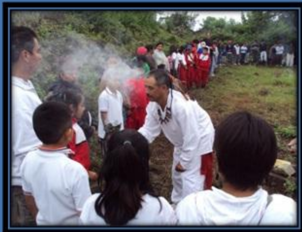
Inicio de actividades del 25º Aniversario del Museo Comunitario Shan Dany de Santa Ana del Valle, Tlacolula, Oaxaca, con el evento de "Celebración de la Herencia Prehispánica" que se llevó a cabo el día 6 de septiembre en el Sitio Arqueológico Iki yá de la misma población.