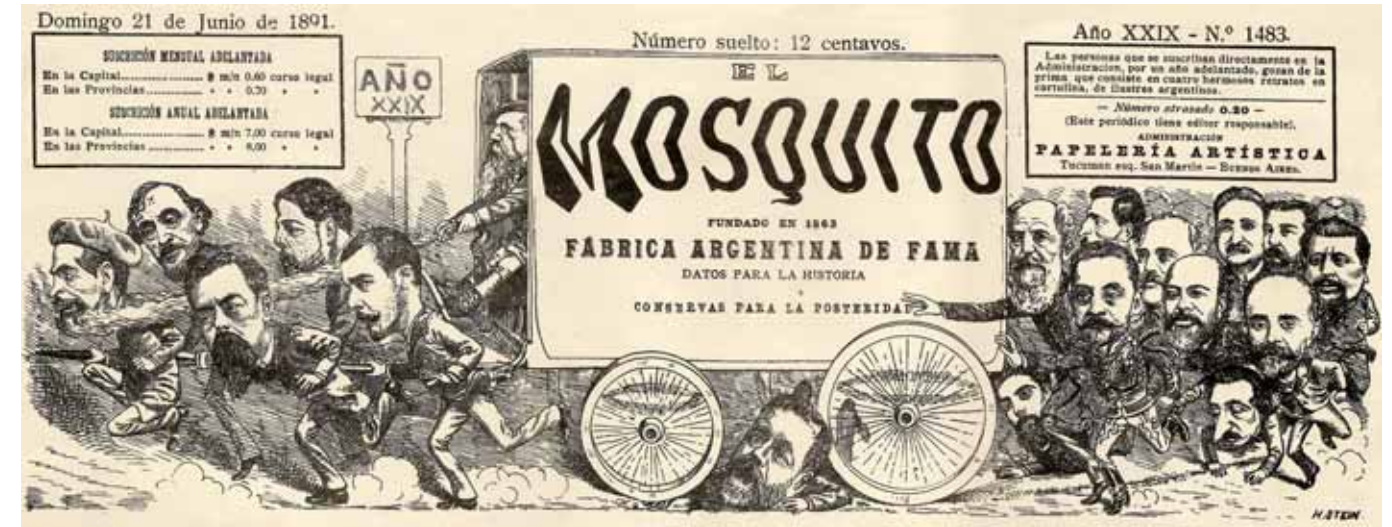
El Mosquito N° 1482 Henri Stein Litografía (1891)

vo relacionado con la ampliación de los debates a un público más vasto. Por este medio, las discusiones políticas trascendían el espacio intra-elites al tiempo que, la caricatura, con su propio lenguaje expresivo dirigía las simpatías y muchas veces definía las acciones de un grupo mucho más grande de la ciudadanía. Además la caricatura se transformaba en el espacio de opinión, burla, satirización y agresión que otros discursos muchas veces no lograban concretar.