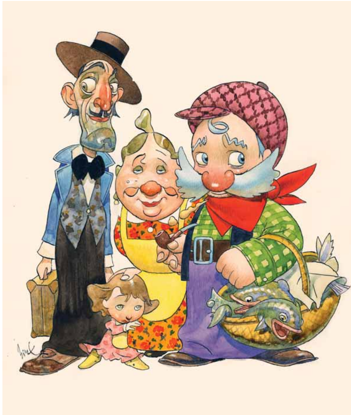
Los inmigrantes Carlos Nine Revista Humi Técnica mixta (1989)