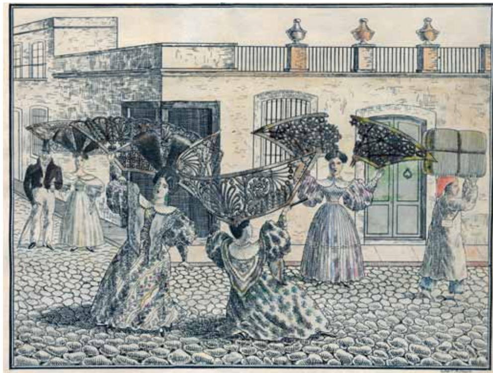
El enlace de los peinetones César Hipólito Bacle Grabado (1834)

La segunda parte del siglo XIX se caracterizó por los importantes debates políticos relacionados con el ingreso del país a la modernidad y el establecimiento de un modelo de nación. La prensa periódica fue uno de los principales escenarios de debate y discusión y junto con los textos y los discursos escritos, se desarrolló ampliamente el campo de la caricatura política. El rol que la caricatura jugaba en estas publicaciones estu-