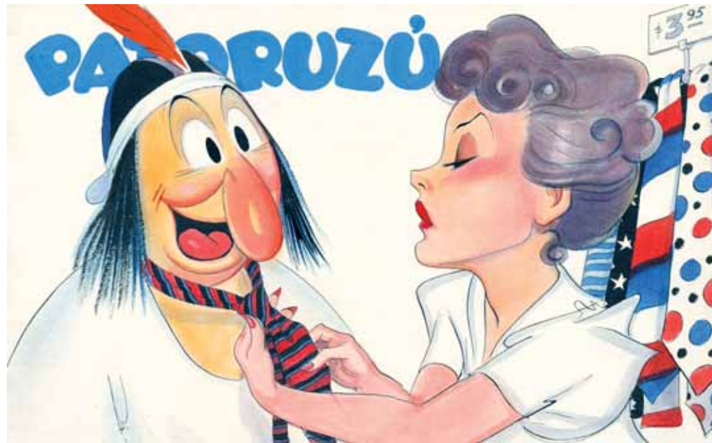
Tapa Patoruzú Dante Quintero Revista Patoruzú N° 69 Técnica mixta (1937)

Frente al estallido de la Segunda Guerra, los humoristas no permanecen al margen: la risa funciona como una catarsis en medio de la crisis política mundial. En 1939, las caricaturas de Flax -Lino Palacio- en el diario La Razón ridiculizan