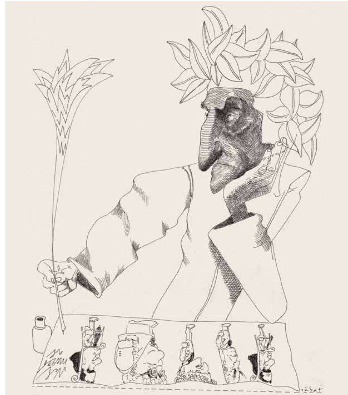
El Dante Hermenegildo Sabat Diario Clarín Tinta china (1990)