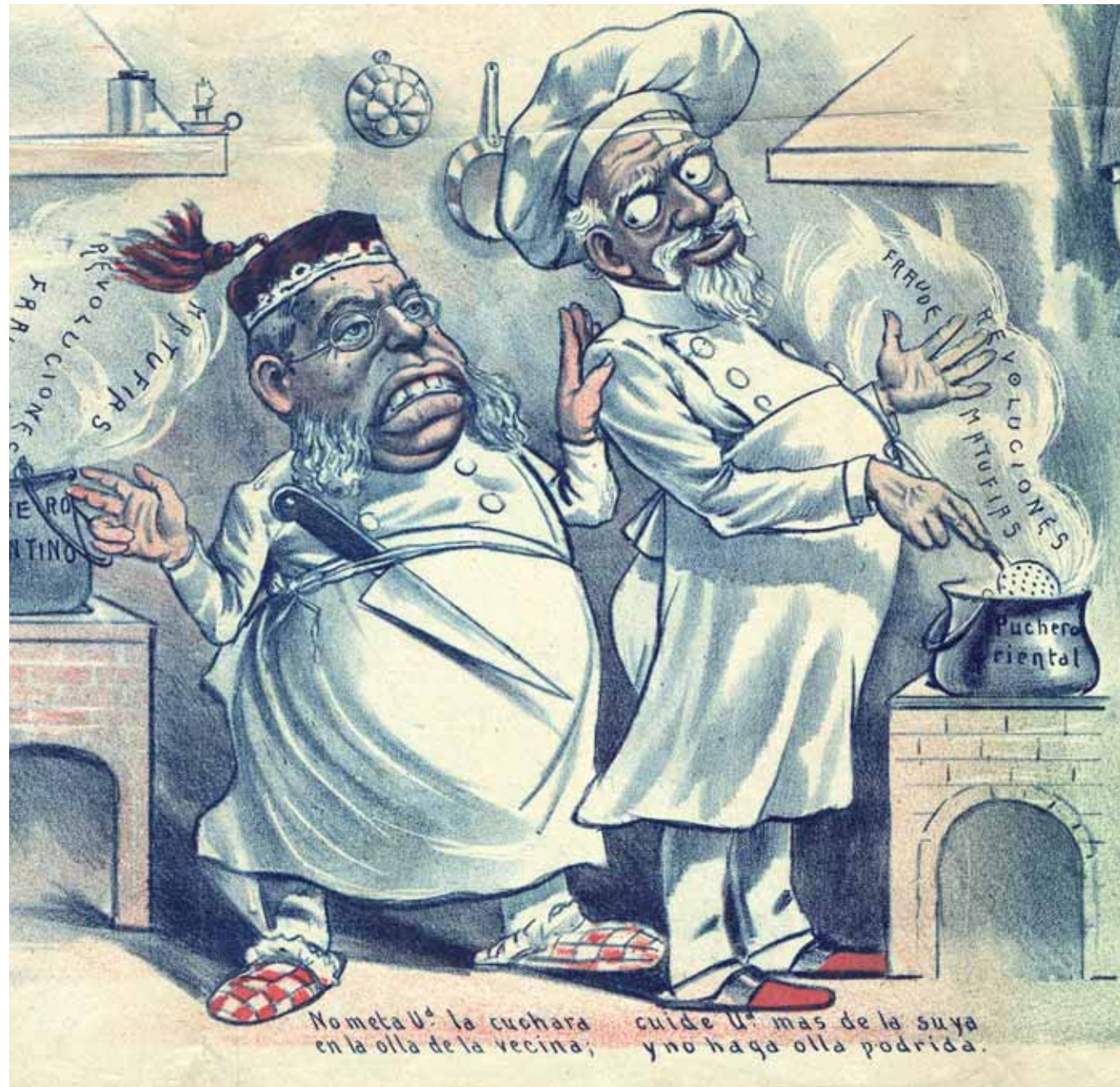
Puchero oriental Eduardo Sojo Periódico Don Quijote Litografía (1898)