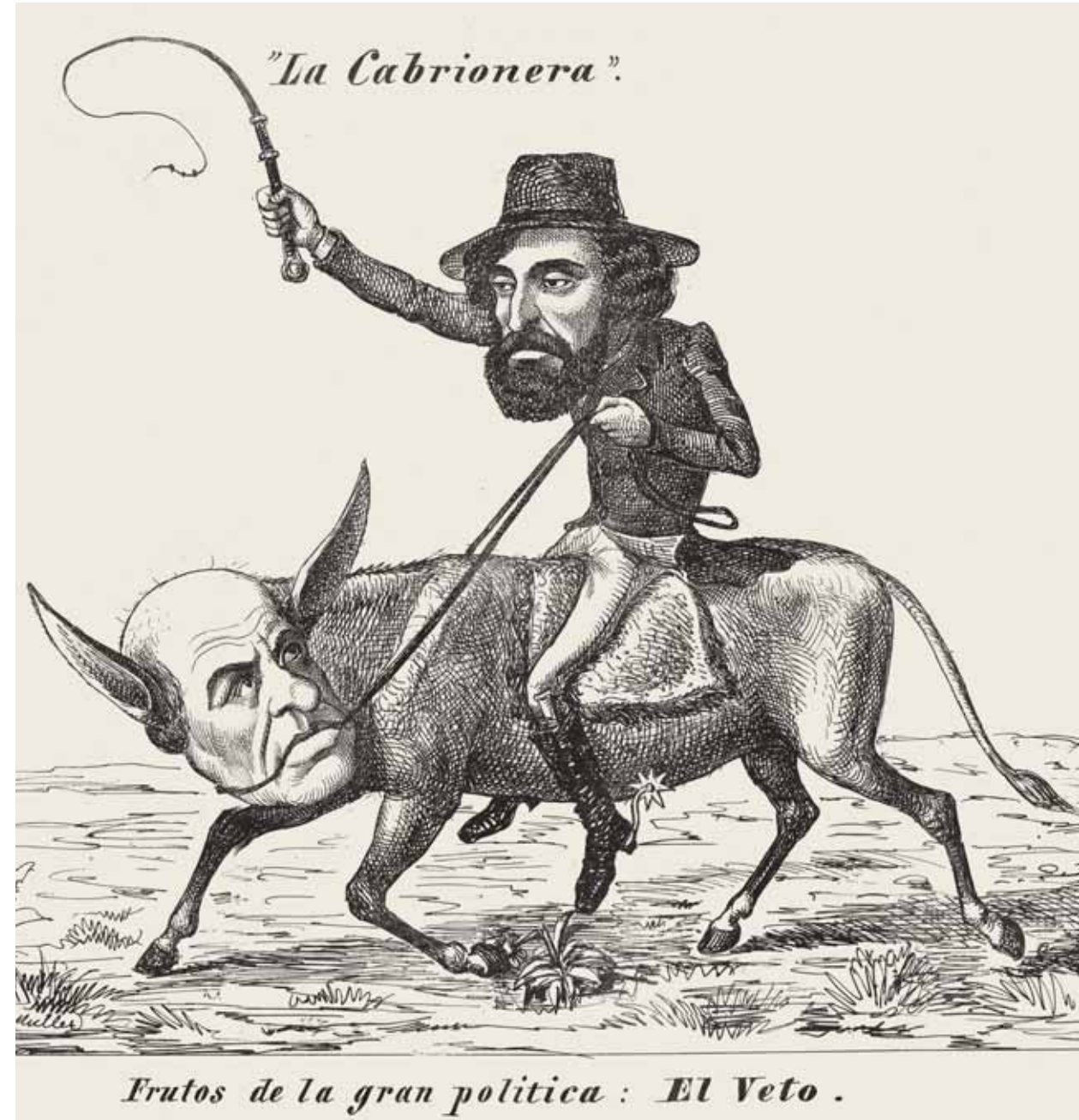
La Presidencia N° 56 Henri Stein Litografía (1874)