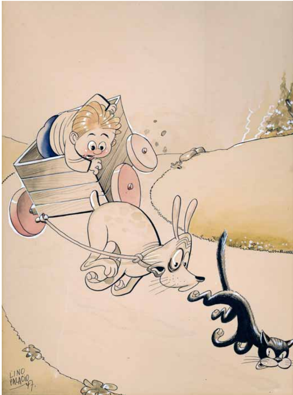
Tapa Lino Palacio Revista Billiken Técnica mixta (1947)