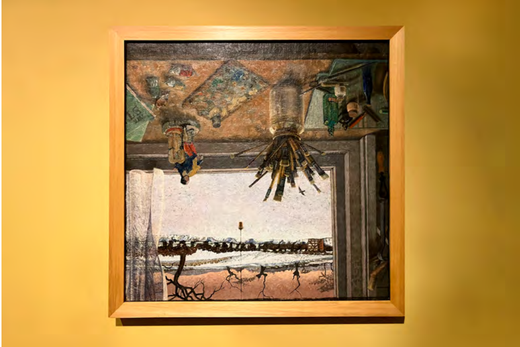
▲ View from the Studio (1930), de Claughton Pellew.

impuesto. Potenciar una desfamiliarización fomenta generar actitudes empáticas. Para poder comprender lo que sucede en el mundo y en las sociedades es necesario ponerse en la posición del Otro ; escuchar, mirar, sentir y pensar como es otredad. Darle la vuelta a una obra de arte se traslada a poner boca abajo el mundo..., voltear nuestros pensamientos. En concreto, lo que deseo expresar es: darles la vuelta a nuestras mentes nos llevará a cuestionar nuestro pensamiento antropocéntrico (Kohn, 2013) –y añadiría aquí: nuestro pensamiento etnocéntrico–, y cambiar nuestra visión utilitarista y colonialista del mundo; de un Yo que se apropia del Otro , para dirigirnos a un Yo que comprende y empatiza con el Otro .