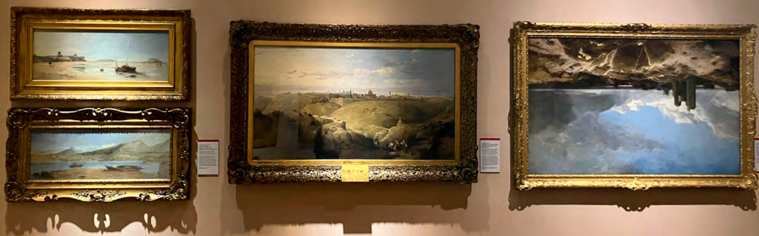
▲ Sala del Norwich Castle Museum y obra colgada boca abajo: Orford Castle, Suffolk (1856), de Henry Bright.

que: (1) lo inesperado actuó como un mecanismo de «chispa» de arranque para despertar la parte cognitiva amodorrada en el silencio monótono de las hileras de cuadros colgados en las paredes de las salas del museo; (2) mi intención ya no era (volver a) ver el museo (pues ya lo conocía), sino buscar las otras cuatro obras de arte que habían sido colgadas boca abajo, ya que no existía señalización para saber en qué sala se ubicaban; en definitiva, el paseo por el museo se convirtió en una yincana, lo que la literatura del sector turístico creo que denomina «edudistracción»; (3) por último, repensar el mundo del revés, no solo descubrir detalles o miradas diferentes sobre obras que ya había visto antes, sino darle la vuelta al mundo.