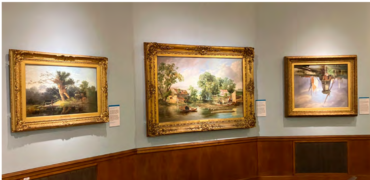
▲ Sala del Norwich Castle Museum y obra colgada boca abajo: On the River Yare (1846), de Alfred Stannard.

Ya sea por motivos de provocación –al espectador o al sistema (artístico)–; por renovar el panorama artístico y buscar nuevas formas de expresión y comunicación; por activismo político y denuncia de un malestar social, cultural e ideológico; o por un «simple» descuido; las cuestiones que me rondaban al transitar por las salas del museo y encontrarme estas obras colocadas en un sentido inverso eran: qué supone para el público contemplar estas obras o la propia esencia de la intervención de Mark Wilsher, y qué relación puede tener con la interpretación del patrimonio . Las líneas que siguen son fruto de las reflexiones suscitadas del contacto directo con la intervención del artista y no dejan de ser eso, unas reflexiones personales a las que les falta un sustento riguroso de información que debería de venir realizando por un estudio del público y un análisis y evaluación desde la óptica de la interpretación del patrimonio. No obstante, mi objetivo es el de señalar que una de las metas que persigue este campo del conocimiento es la de «poner boca abajo», en un sentido cognitivo y emocional, los imaginarios del público.