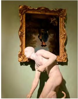
Número 50 | Septiembre 2024