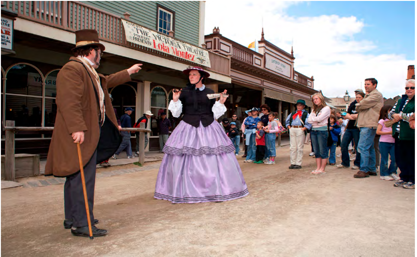
▲ Teatro interpretativo en el Museo al Aire Libre Sovereign Hill, Victoria, Australia.

Por supuesto, me estoy refiriendo a un medio de cuerpo cálido y piel curtida: un ser humano que presenta la interpretación a través del contacto personal cara a cara con una audiencia.