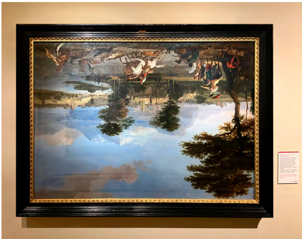
▲ The Stag Hunt , de Abraham Hondius, hacía 1675.

de la Historia del Arte, tampoco existía una explicación en las salas; con lo que era complicado responder a las preguntas que planteaba en el anterior párrafo y discernir cuál era el objetivo final que se pretendía. Lo que sí era cierto es que ver obras de arte colgadas del revés conseguía: (1) despertar la mirada esteta durante una monótona visita a «criaturas congeladas» 4 en los muros de las salas; (2) acercarte a esas obras para profundizar en detalles de los que no te habrías percatado anteriormente, incluso aproximarte a obras que, de haber estado colgadas en su sentido correcto, quizás no lo hubieras hecho; (3) plantearte justo lo que apuntaba en el punto 2: ¿Cuál es la «forma correcta» de colgar las obras, o cuál es su sentido correcto?