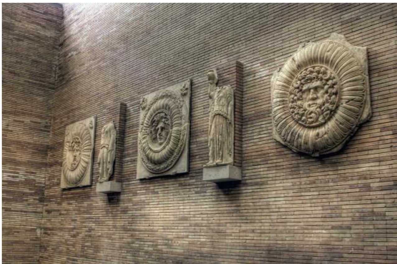
Exposición permanente del Museo Nacional de Arte Romano de Mérida.

Paradójicamente, mi primer contacto con la interpretación del patrimonio no tuvo nada que ver con Tilden. Fue en 1991, en la Escuela de Patrimonio de Barcelona. Allí conocí, de la mano del profesor de la Universidad de Swansea, Terry Stevens, los «Planes Estratégicos de Interpretación del Patrimonio», entre otros, el Plan de Interpretación de la ciudad galesa de Conwy, que nos proporcionó una «hoja de ruta» para llevar a cabo proyectos similares que realizamos entre 1990 y el 2000, primero en la Fundación Centro Europeo del Patrimonio y desde 1995 ya en Stoa. Estos proyectos nos llevaron a establecer una metodología de trabajo en la que combinábamos la tradición interpretativa británica con la tradición francesa de la puesta en valor del patrimonio: «Garraf, el espíritu del romanticismo», «Úbeda, el renacimiento que mira al sur», «Cartagena, puerto de culturas», «Lorca, taller del tiempo», «Gerês, o ecomuseu da montanha» o «Reus, museo abierto del modernismo», son algunos de los planes estratégicos en los que pusimos a prueba la eficacia de la interpretación como método de planificación estratégica del patrimonio. Algunos de esos planes aún gozan de buena salud, mientras que otros han caído en el olvido. Pero todos ellos significaron la primera experiencia de planificación estratégica de la interpretación del patrimonio en España.