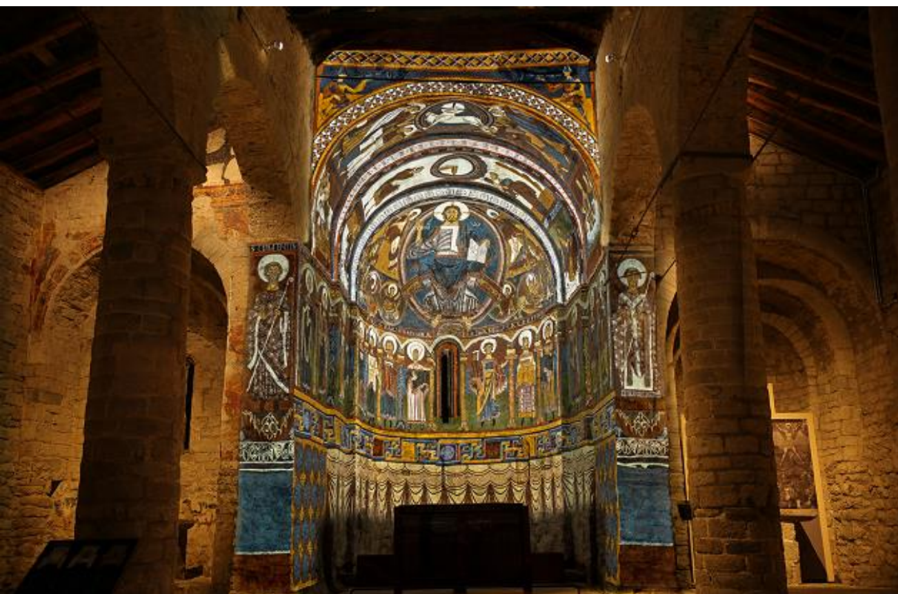
«Taüll 1123», experiencia audiovisual en Sant Climent de Taüll.

En cambio, la interpretación heredera de la tradición de Tilden, piensa a la vez en el patrimonio y en el público, como sucede en la Iglesia de Sant Climent de Taüll, que albergó en la Edad Media unos frescos excepcionales y que actualmente alberga la experiencia audiovisual «Taüll 1123» 2 , que es a su vez también una pieza interpretativa excepcional.