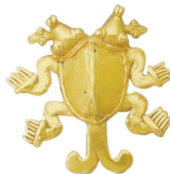
Colgante , oro, 4,9 x 4,7 cm, Museo Nacional de Costa Rica, Colección Patrimonio Arqueológico de Costa Rica