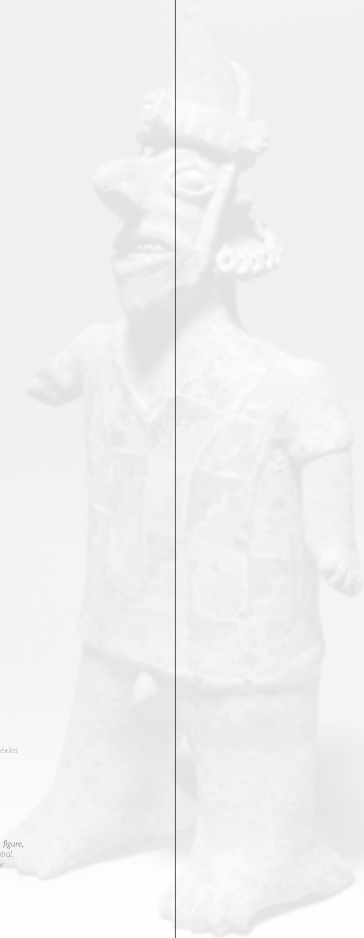
Figura Nayarit / Nayarit figure, Museo Nacional de Antropología, México