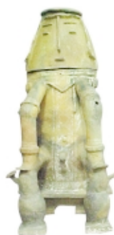
Urna Macará, cerámica, alto: 66 cm, Museu Paraense Emilio Goeldi, Brasil Macará urn, ceramic, high: 66 cm, Museu Paraense Emilio Goeldi, Brazil