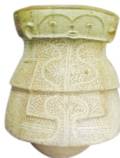
Urna Cunani, cerámica, alto: 78 cm, Museu Paraense Emilio Goeldi, Brasil Cunani urn, ceramic, high: 78 cm, Museu Paraense Emilio Goeldi, Brazil