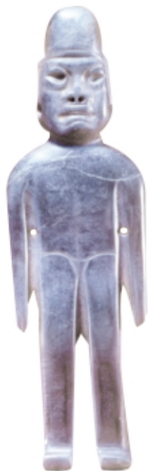
Figurilla olmeca, jade, 10,8 x 3,2 cm, Museo Nacional de Antropología, México