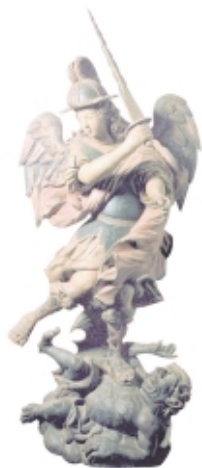
Arcángel San Miguel , madera, Museo de la Misión Jesuítica de los Guaraníes de Santa María de Fe, Paraguay Archangel Michael , wood, Museo de la Misión Jesuítica de los Guaraníes de Santa María de Fe, Paraguay