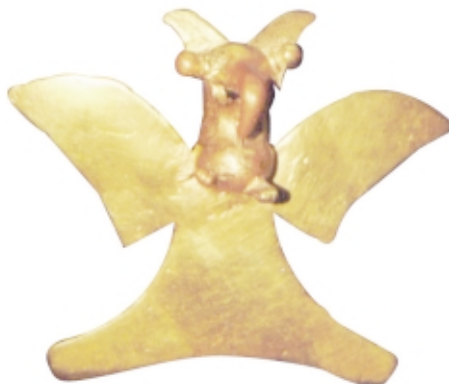
Colgante , oro, 7 x 8,6 cm, pieza robada del Museo Antropológico de Araúz, Ciudad de Panamá

Pendant , gold, 7 x 8,6 cm, stolen from the Museo Antropológico de Araúz, Ciudad de Panamá