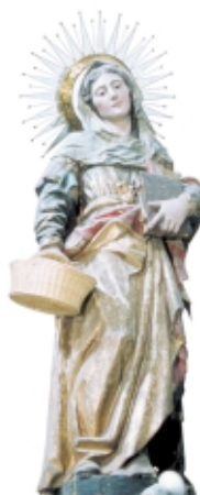
Santa Ana , madera, Iglesia San Joaquín, D.F. Tacuba, México Saint Anne , wood, Iglesia San Joaquín, D.F. Tacuba, Mexico