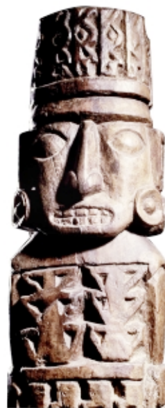
Detalle del Idolo de Pachacamac, madera, 2,2 m x 30 cm, Museo de sitio de Pachacamac, Perú Detail of the Pachacamac Idol, wood, 2.2 m x 30 cm, Museo de sitio de Pachacamac, Peru