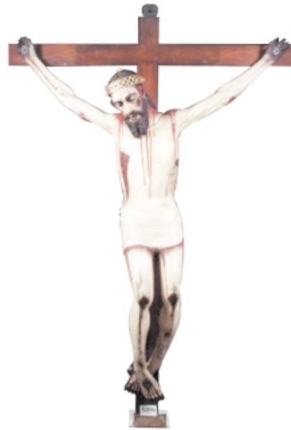
Cristo de pasta de maíz, 2,6 x 1,9 m, Parroquia de San Martín Ixtacalco, D.F., México Corn-stem paste Christ, 2,6 x 1,9 m, Parroquia de San Martín Ixtacalco, D.F., Mexico