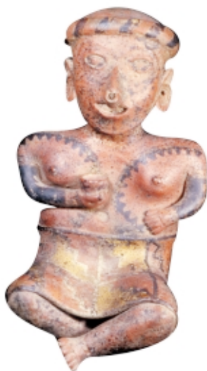
Figura Nayarit, cerámica, 33,8 x 18,2 cm, Museo Nacional de Antropología, México Nayarit figure, ceramic, 33.8 x 18.2 cm, Museo Nacional de Antropología, Mexico