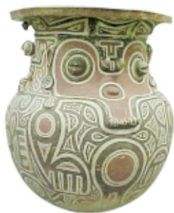
Urna Marajoará, cerámica, alto: 84 cm, Museu Paraense Emilio Goeldi, Brasil Marajoará urn, ceramic, high: 84 cm, Museu Paraense Emilio Goeldi, Brazil