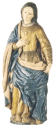
Virgen María , madera, 58 x 28 cm, Museo de Arte Colonial de Bogotá, Colombia Virgen Mary , wood, 58 x 28 cm, Museo de Arte Colonial de Bogotá, Colombia