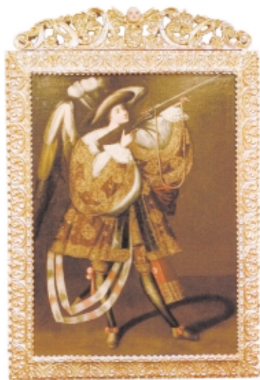
Ángel Arcabuzero , Maestro de Calamarca, óleo sobre lienzo, 1,6 x 1,1 m, Museo Nacional de Arte, Bolivia Angel with harquebus , Master of Calamarca, oil on canvas, 1.6 x 1.1 m, Museo Nacional de Arte, Bolivia