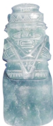
Colgante hacha , jade, 8.1 x 4.5 cm, Museo Nacional de Costa Rica, Colección Patrimonio Arqueológico de Costa Rica

Hacha pendant , jade, 8.1 x 4.5 cm, Museo Nacional de Costa Rica, Colección Patrimonio Arqueológico de Costa Rica