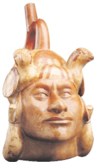
Vasija Moche , cerámica, 33 x 17 cm, Museo Nacional de Arqueología, Antropología e Historia del Perú Moche vessel , ceramic, 33 x 17 cm, Museo Nacional de Arqueología, Antropología e Historia del Perú