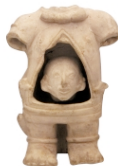
Figura Tumaco-Tolita, cerámica, 17,8 x 12,6 cm, Museo Nacional de Colombia, Colección ICANH Tumaco-Tolita figure, ceramic, 17,8 x 12,6 cm, Museo Nacional de Colombia, Colección ICANH