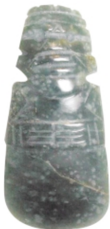
Colgante hacha , jade, 9.4 x 5.2 cm, Museo Nacional de Costa Rica, Colección Patrimonio Arqueológico de Costa Rica

Hacha pendant , jade, 9.4 x 5.2 cm, Museo Nacional de Costa Rica, Colección Patrimonio Arqueológico de Costa Rica