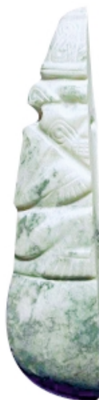
Colgante hacha partido por la mitad , jade, 9.2 x 1.9 cm, Museo Nacional de Costa Rica, Colección Patrimonio Arqueológico de Costa Rica

Hacha pendant cut in two , jade, 9.2 x 1.9 cm, Museo Nacional de Costa Rica, Colección Patrimonio Arqueológico de Costa Rica