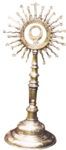
Custodia, plata, 74 x 34 cm, Museo de Arte Colonial de Bogotá, Colombia Monstrance, silver, 74 x 34 cm, Museo de Arte Colonial de Bogotá, Colombia