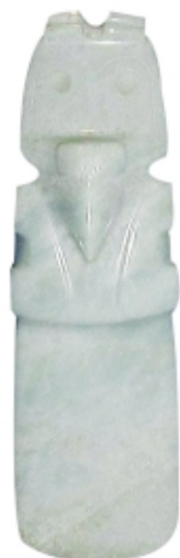
Colgante hacha , jade, 7.1 x 3.3 cm, Museo Nacional de Costa Rica, Colección Patrimonio Arqueológico de Costa Rica

Hacha pendant , jade, 7.1 x 3.3 cm, Museo Nacional de Costa Rica, Colección Patrimonio Arqueológico de Costa Rica