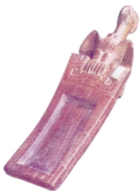
Tableta para alucinógenos, madera, alto: 17,3 cm, Museo Arqueológico Padre Le Paige, Chile Snuff tray, wood, high: 17.3 cm, Museo Arqueológico Padre Le Paige, Chile