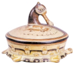
Vasija maya policroma, cerámica, 15,5 x 16,5 cm, Museo Nacional de Arqueología y Etnología, Guatemala

Maya polychrome vessel, ceramic, 15.5 x 16.5 cm, Museo Nacional de Arqueología y Etnología, Guatemala