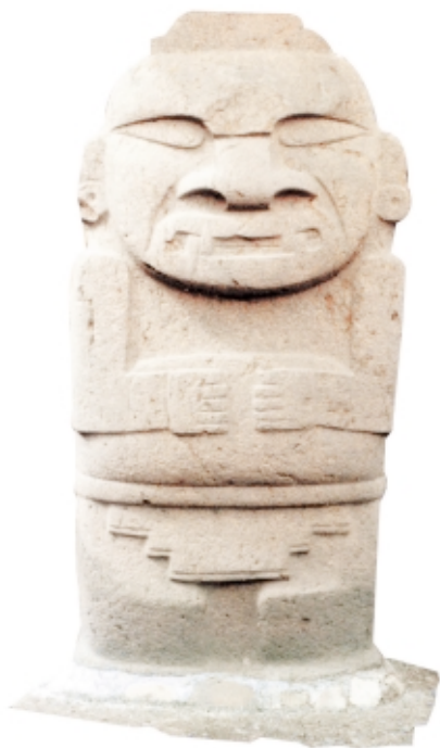
Estatua 10 , Mesita A, piedra, 2,6 x 1,2 m, Parque Arqueológico de San Agustín, Colombia

Statue 10 , Mesita A, stone, 2,6 x 1,2 m, Parque Arqueológico de San Agustín, Colombia