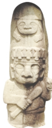
Estatua 26 , Mesita B, piedra, 1,8 m x 73 cm, Parque Arqueológico de San Agustín, Colombia

Statue 26 , Mesita B, stone, 1,8 m x 73 cm, Parque Arqueológico de San Agustín, Colombia