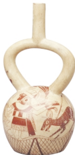
Vasija Moche , cerámica, 35 x 18 cm, Museo Nacional de Arqueología, Antropología e Historia del Perú Moche vessel , ceramic, 35 x 18 cm, Museo Nacional de Arqueología, Antropología e Historia del Perú