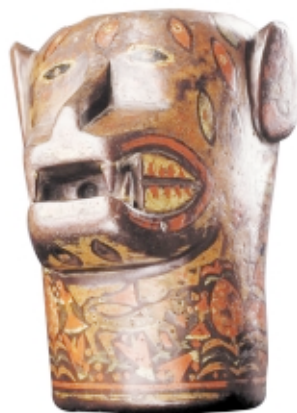
Kero Inca , madera, 35 x 16 cm, Museo Regional de Cusco, Peru

Inca kero , wood, 35 x 16 cm, Museo Regional de Cusco, Peru