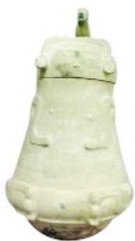
Urna Guarita, cerámica, alto: 45,5 cm, Museu Paraense Emilio Goeldi, Brasil Guarita urn, ceramic, high: 45.5 cm, Museu Paraense Emilio Goeldi, Brazil