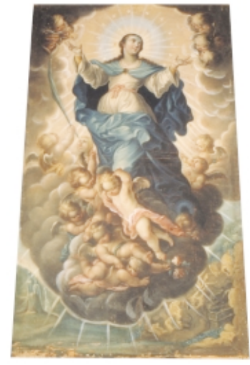
Inmaculada , anónimo, óleo sobre tabla, San Miguel de Allende, México The Immaculate One , anonymous, oil on canvas, San Miguel de Allende, Mexico