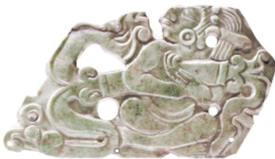
Colgante placa maya, jade, 5 x 9 cm, Museo Nacional de Antropología, México Maya pendant, jade, 5 x 9 cm, Museo Nacional de Antropología, Mexico