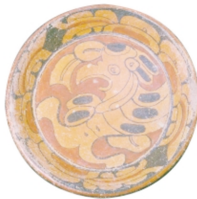
Vasija maya policroma, cerámica, diámetro: 29,2 cm, Museo Regional de Antropología de Mérida, México

Maya polychrome vessel, ceramic, diameter: 29.2 cm, Museo Regional de Antropología de Mérida, Mexico