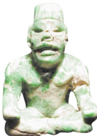
Figurilla olmeca, jade, 6,5 x 4,5 cm, Museo Nacional de Antropología, México