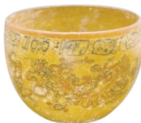
Vasija maya policroma, cerámica, alto: 12,5 cm, Museo Nacional de Arqueología y Etnología, Guatemala

© Museo Nacional de Arqueología y Etnología