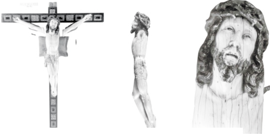
Cristo de marfil, Templo de San Buenaventura de Chihuahua, México Ivory Christ, Templo de San Buenaventura de Chihuahua, Mexico