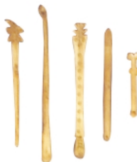
Accesorios: cucharas y tubos para aspirar, madera, alto: 10-20 cm, Museo Arqueológico Padre Le Paige, Chile Implements for taking snuff: tubes and spoons, wood, high: 10-20 cm, Museo Arqueológico Padre Le Paige, Chile