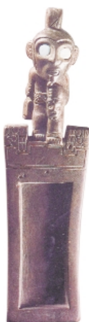
Tableta para alucinógenos, madera, alto: 18,8 cm, Museo Arqueológico Padre Le Paige, Chile Snuff tray, wood, high: 18.8 cm, Museo Arqueológico Padre Le Paige, Chile