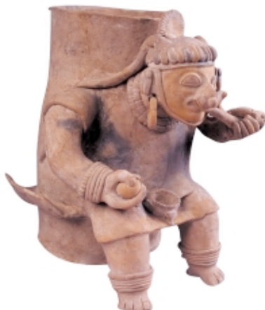
Vasija Jama Coaque, cerámica, 29,3 x 23,9 cm, Museo Antropológico del Banco Central, Colección Banco Central del Ecuador

Jama Coaque figure, ceramic, 29,3 x 23,9 cm, Museo Antropológico del Banco Central, Colección Banco Central del Ecuador