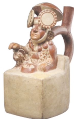
Vasija Moche , cerámica, 29 x 18 cm, Museo Nacional de Arqueología, Antropología e Historia del Perú Moche vessel , ceramic, 29 x 18 cm, Museo Nacional de Arqueología, Antropología e Historia del Perú