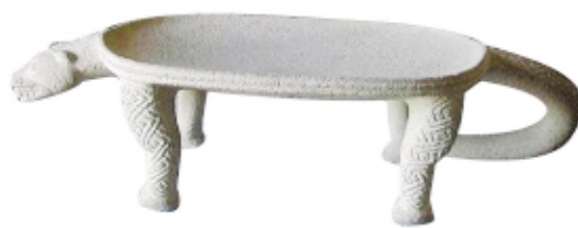
▲ Piedra de moler escultórica, piedra, 17 x 46 cm, Museo Nacional de Costa Rica, Colección Patrimonio Arqueológico de Costa Rica Openwork grindstone, stone, 17 x 46 cm, Museo Nacional de Costa Rica, Colección Patrimonio Arqueológico de Costa Rica