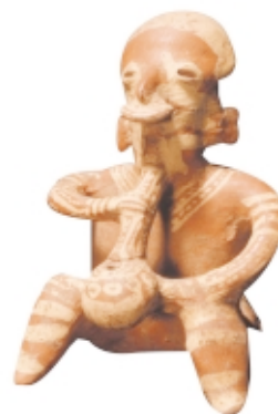
Figura Nayarit, cerámica, 20,2 x 13 cm, Museo Nacional de Antropología, México Nayarit figure, ceramic, 20.2 x 13 cm, Museo Nacional de Antropología, Mexico