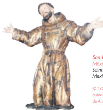
San Francisco , madera, Tepetzotlán, México Saint Francis , wood, Tepetzotlán, Mexico