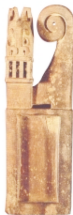
Tableta para alucinógenos, madera, alto: 13,4 cm, Museo Arqueológico Padre Le Paige, Chile Snuff tray, wood, high: 13.4 cm, Museo Arqueológico Padre Le Paige, Chile