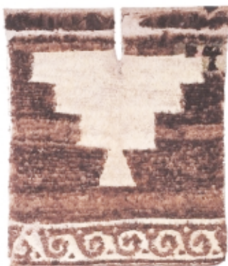
◀ Unku Wari , alto: 55 cm, Museo Nacional de Arqueología, Antropología e Historia del Perú, Wari unku , high: 55 cm, Museo Nacional de Arqueología, Antropología e Historia del Perú