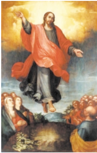
La Ascensión del Señor , Alonso López de Herrera, óleo sobre tabla, 2,4 x 1,6 m, México The Ascension of our Lord , Alonso López de Herrera, oil on canvas, 2,4 x 1,6 m, Mexico