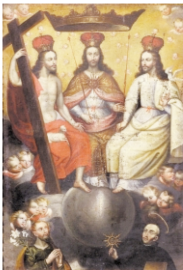
Trinidad , óleo sobre lienzo, 1,2 m x 68 cm, Museo Regional de Cusco, Perú Trinity , oil on canvas, 1,2 m x 68 cm, Museo Regional de Cusco, Perú