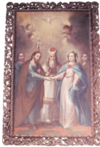
Desposorios , anónimo, óleo sobre tabla, D.F. San Francisco, México Wedding Ceremony , anonymous, oil on canvas, D.F. San Francisco, Mexico