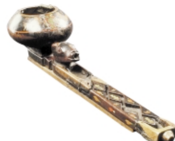
Pajcha Inca , madera, 13 x 35 cm, Museo Regional de Cusco, Perú

Inca Pajcha , wood, 13 x 35 cm, Museo Regional de Cusco, Peru