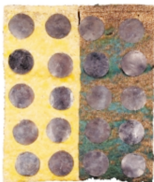
◀ Unku Nasca , 55 x 42 cm, Museo Nacional de Arqueología, Antropología e Historia del Perú, Nasca unku , 55 x 42 cm, Museo Nacional de Arqueología, Antropología e Historia del Perú