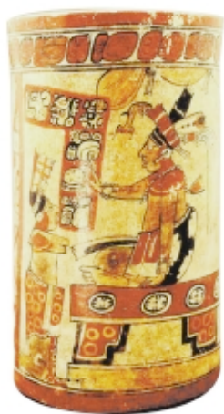
Vasija maya policroma, cerámica, alto: 30,5 cm, Museo Nacional de Arqueología y Etnología, Guatemala

Maya polychrome vessel, ceramic, high: 30.5 cm, Museo Nacional de Arqueología y Etnología, Guatemala