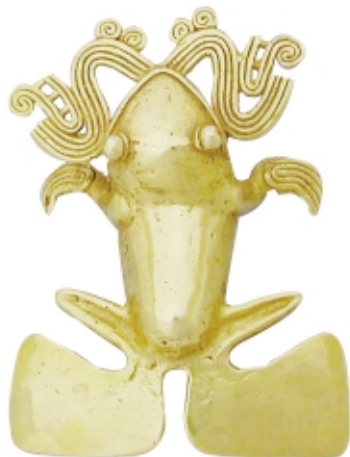
Colgante , oro, 7,8 x 5,7 cm, Museo Nacional de Costa Rica, Colección Patrimonio Arqueológico de Costa Rica

Pendant , gold, 7,8 x 5,7 cm, Museo Nacional de Costa Rica, Colección Patrimonio Arqueológico de Costa Rica