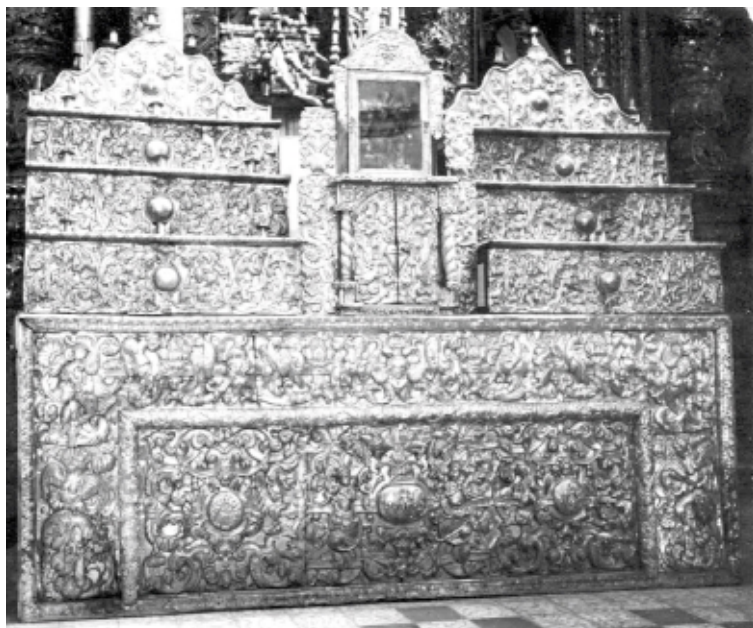
Frontal, gradillas y sagrario, plata, 2 x 2,6 m, Iglesia Jesús de Machaca, La Paz, Bolivia

Frontal, stepped section and tabernacle, silver, 2 x 2.6 m, Iglesia Jesús de Machaca, La Paz, Bolivia