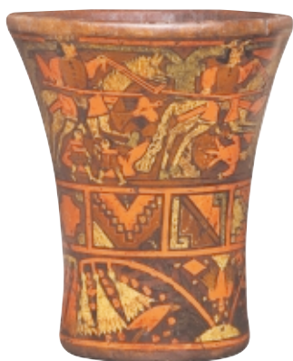
Kero Inca , madera, alto: 28 cm, Museo Inca de Cusco, Perú

Inca kero , wood, high: 28 cm, Museo Inca de Cusco, Peru