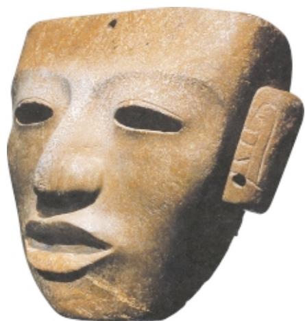
Máscara teotihuacana, piedra, 21 x 25,5 cm, Museo Nacional de Antropología, México

Teotihuacan mask, stone, 21 x 25.5 cm, Museo Nacional de Antropología, Mexico