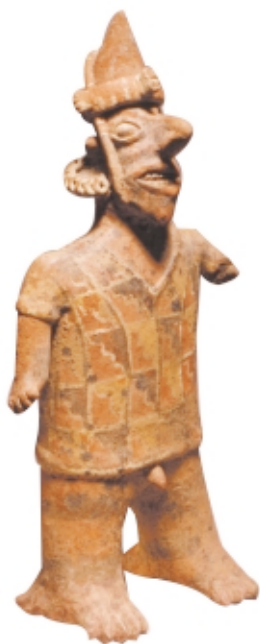
Figura Nayarit, cerámica, 40,3 x 19,5 cm, Museo Nacional de Antropología, México Nayarit figure, ceramic, 40.3 x 19.5 cm, Museo Nacional de Antropología, Mexico