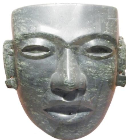
Máscara teotihuacana, piedra, 18,5 x 17 cm, Museo Nacional de Antropología, México