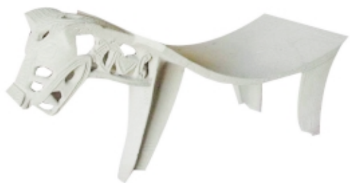
▲ Piedra de moler escultórica, piedra, 46 x 80 cm, Museo Nacional de Costa Rica, Colección Patrimonio Arqueológico de Costa Rica Openwork grindstone, stone, 46 x 80 cm, Museo Nacional de Costa Rica, Colección Patrimonio Arqueológico de Costa Rica