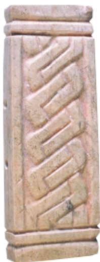
Colgante placa maya, jade, 11,3 x 4,2 cm, Museo Nacional de Arqueología y Etnología, Guatemala Maya pendant, jade, 11.3 x 4.2 cm, Museo Nacional de Arqueología y Etnología, Guatemala