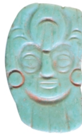
Colgante placa maya, jade, 4,5 x 3,4 cm, Museo Nacional de Arqueología y Etnología, Guatemala Maya pendant, jade, 4.5 x 3.4 cm, Museo Nacional de Arqueología y Etnología, Guatemala