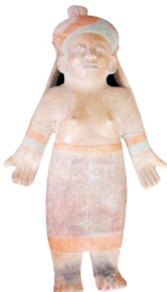
Figura Jama Coaque, cerámica, 54 x 28 cm, Museo Antropológico del Banco Central, Colección Banco Central del Ecuador

Jama Coaque figure, ceramic, 54 x 28 cm, Museo Antropológico del Banco Central, Colección Banco Central del Ecuador