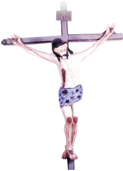
Cristo de pasta de maíz, Parroquia de Nuestra Señora de la Asunción, Santa Fe de los Altos D.F., México Corn-stem paste Christ, Parroquia de Nuestra Señora de la Asunción, Santa Fe de los Altos D.F., Mexico