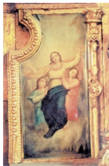
Ascensión de la Virgen , Luis Cadena, óleo sobre lienzo, 1,1 m x 50 cm, pieza robada en 1993 de la Capilla del Rosario, Convento de Santo Domingo, Quito, Ecuador The Ascension of the Virgin , Luis Cadena, oil on canvas, 1.1 m x 50 cm, stolen from the Capilla del Rosario, Convento de Santo Domingo, Quito, Ecuador