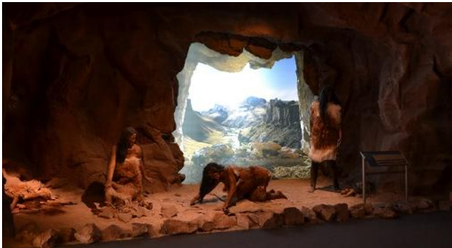
Museo Paleontológico Egidio Feruglio

plantas silvestres, sus nombres, creencias y usos tradicionales comienzan a olvidarse o perderse también. A la extinción biológica le sigue la extinción cultural. Esto se puede palpar en cualquier ámbito urbano donde un ciudadano elegido al azar suele ser incapaz de dar los nombres de diez especies autóctonas de animales o plantas de su paisaje original (pre-urbano). Menos capaz será de asociar esas formas de vida con elementos de su cultura.