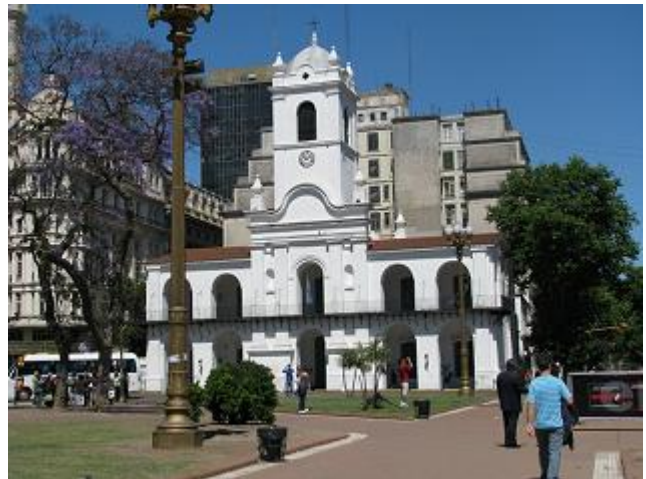
Cabildo de la ciudad de Buenos Aires

urbanos son contenedores de Ghery, con productos de Picasso, en contextos desestructurados.