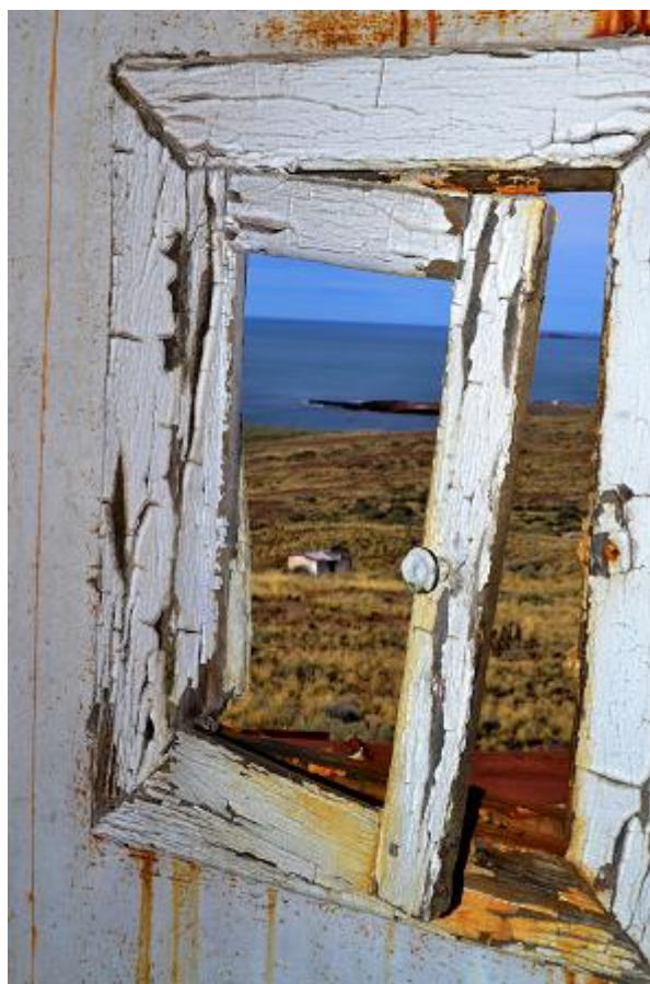
Faro de Isla Leones, Parque Nacional Marino Patagonia

En ese contexto de crisis, la interpretación es una herramienta primaria y poderosa para enfrentarla. Y aunque el patrimonio tiene sus estudiosos y defensores, generalmente estos están separados (hasta institucionalmente) de acuerdo a su especialidad. A veces se nos olvida que el patrimonio es una unidad como un ecosistema, aunque pueda ser observada, analizada, estudiada, admirada, intervenida, aprovechada o comunicada desde un ángulo acotado . Por eso, en ese intento clasificatorio hablamos de patrimonio material, inmaterial, natural o cultural, como lo hace la taxonomía con los seres