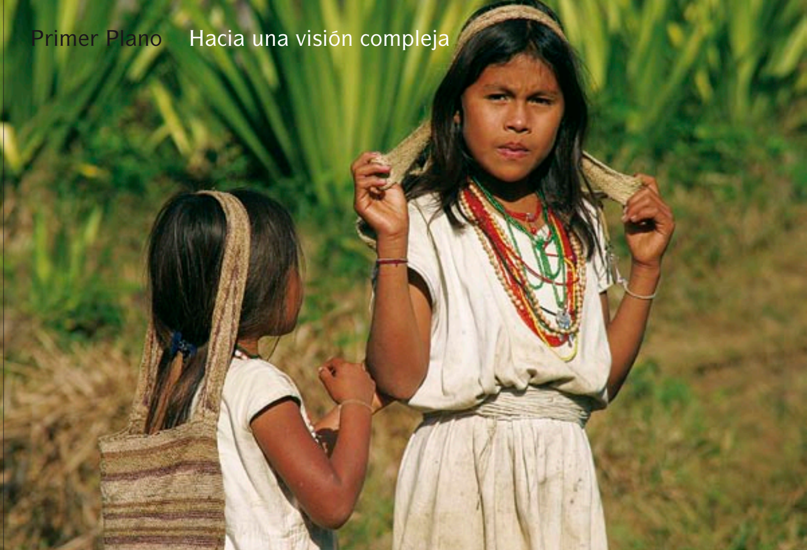
Jóvenes Arhuaco, cerca del poblado indígena de Bunkwámake (Colombia). Los vínculos entre el patrimonio cultural y la diversidad biológica son una clave importante del desarrollo sostenible.