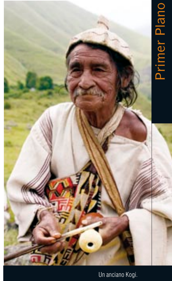
Un anciano Kogi.

El territorio indígena, o “Corazón del Mundo” como lo llaman sus habitantes, está delimitado por una serie de sitios sagrados interconectados. Cada uno de ellos es referente de la ley de origen que rige el comportamiento social, cultural y ambiental de la comunidad. Cada sitio sagrado —lagunas, ríos que bañan extensas zonas agrícolas y desembocan en el mar