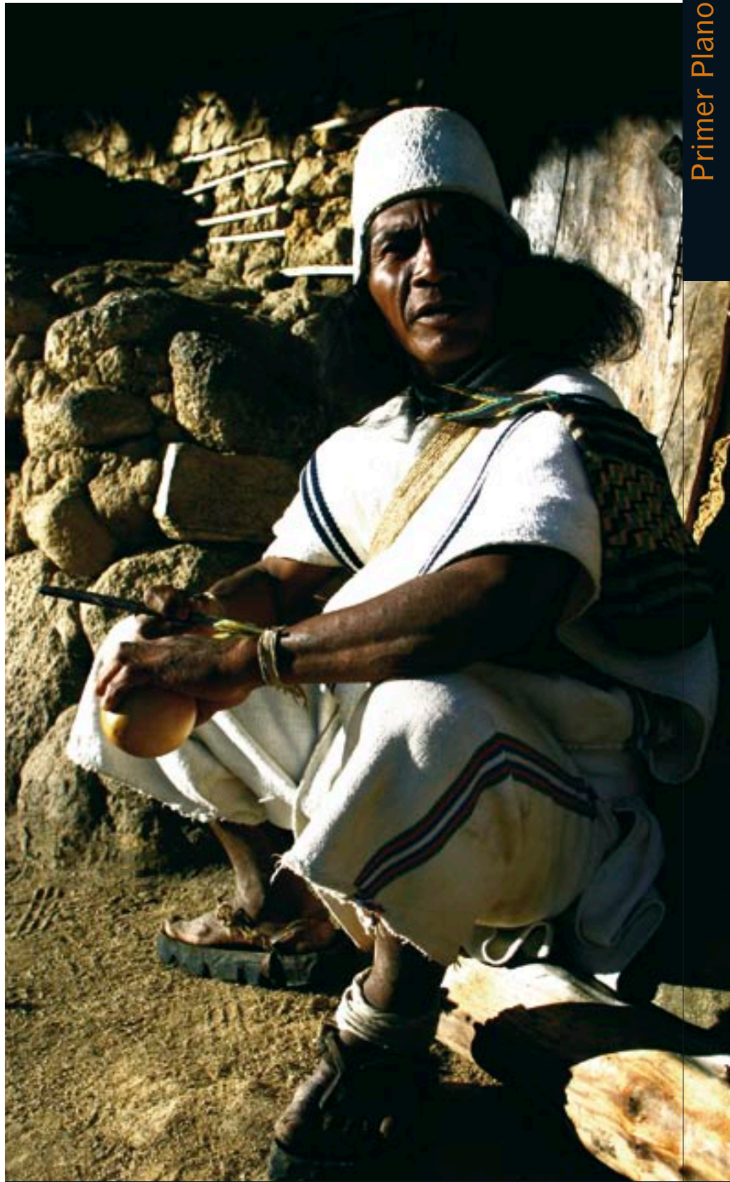
El patrimonio medio ambiental y cultural de las tribus autóctonas como los Arhuaco debe ser protegido.

La historia de la humanidad ha mostrado cómo en repetidas ocasiones los poderes dominantes han impuesto sus lenguas y su visión cultural a otros territorios y culturas. En el proceso de globalización que estamos viviendo es hora de hacer un alto en el camino y ver en la diversidad una herramienta indispensable para superar los problemas que enfrenta nuestra civilización. Territorios como el de la Sierra Nevada de Santa Marta merecen que prosigamos los avances realizados hasta la fecha por la comunidad internacional y perseveremos en la tarea de proteger el patrimonio de la humanidad. 🌱