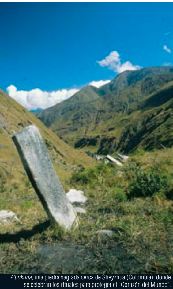
A'tínkuna, una piedra sagrada cerca de Sheyzhua (Colombia), donde se celebran los rituales para proteger el "Corazón del Mundo".

una utilización racional de los recursos de la biosfera y crear conciencia sobre la necesidad de su conservación para mejorar la relación global entre los seres humanos y el medio ambiente.