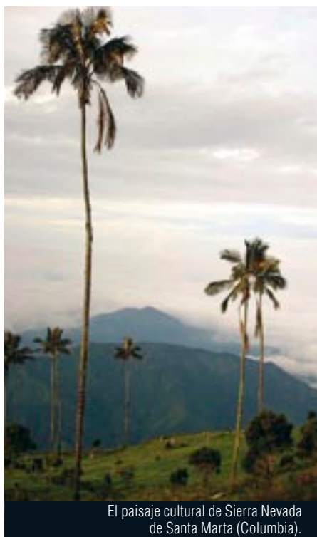
El paisaje cultural de Sierra Nevada de Santa Marta (Colombia).

La Conferencia General de la UNESCO de 1972 aprobó la Convención sobre la Protección del Patrimonio Mundial, Cultural y Natural. Ese instrumento normativo reconoce que la evolución de la vida social y económica amenaza con destruir de manera significativa el patrimonio cultural y natural y advierte además que su destrucción o deterioro acarrea un empobrecimiento