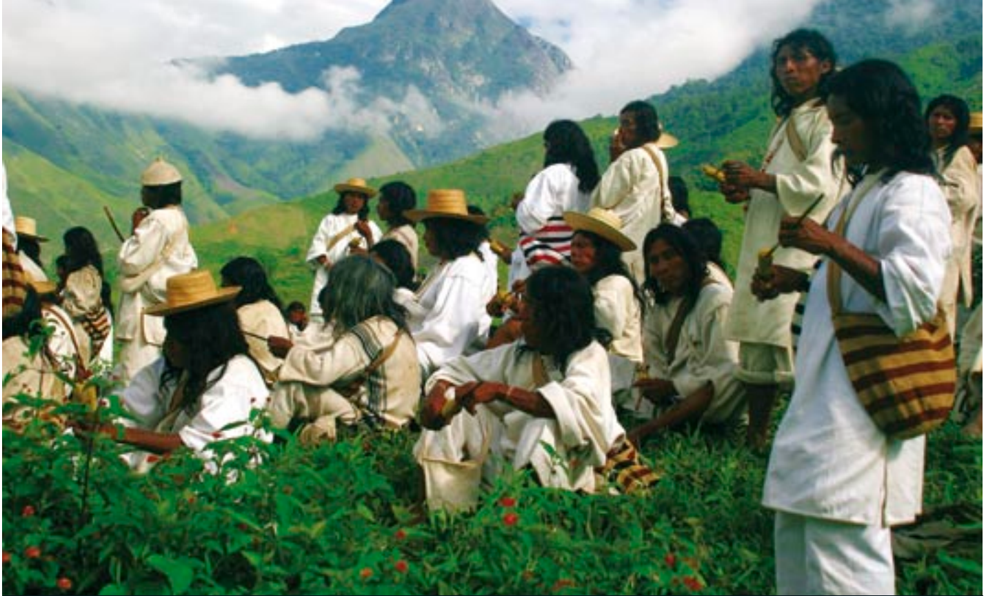
Una reunión de los líderes espirituales Kogi, o Mamas , cerca del río San Miguel. Los Kogi son muy sensibles a los desequilibrios ecológicos que podrían afectar a las futuras generaciones.