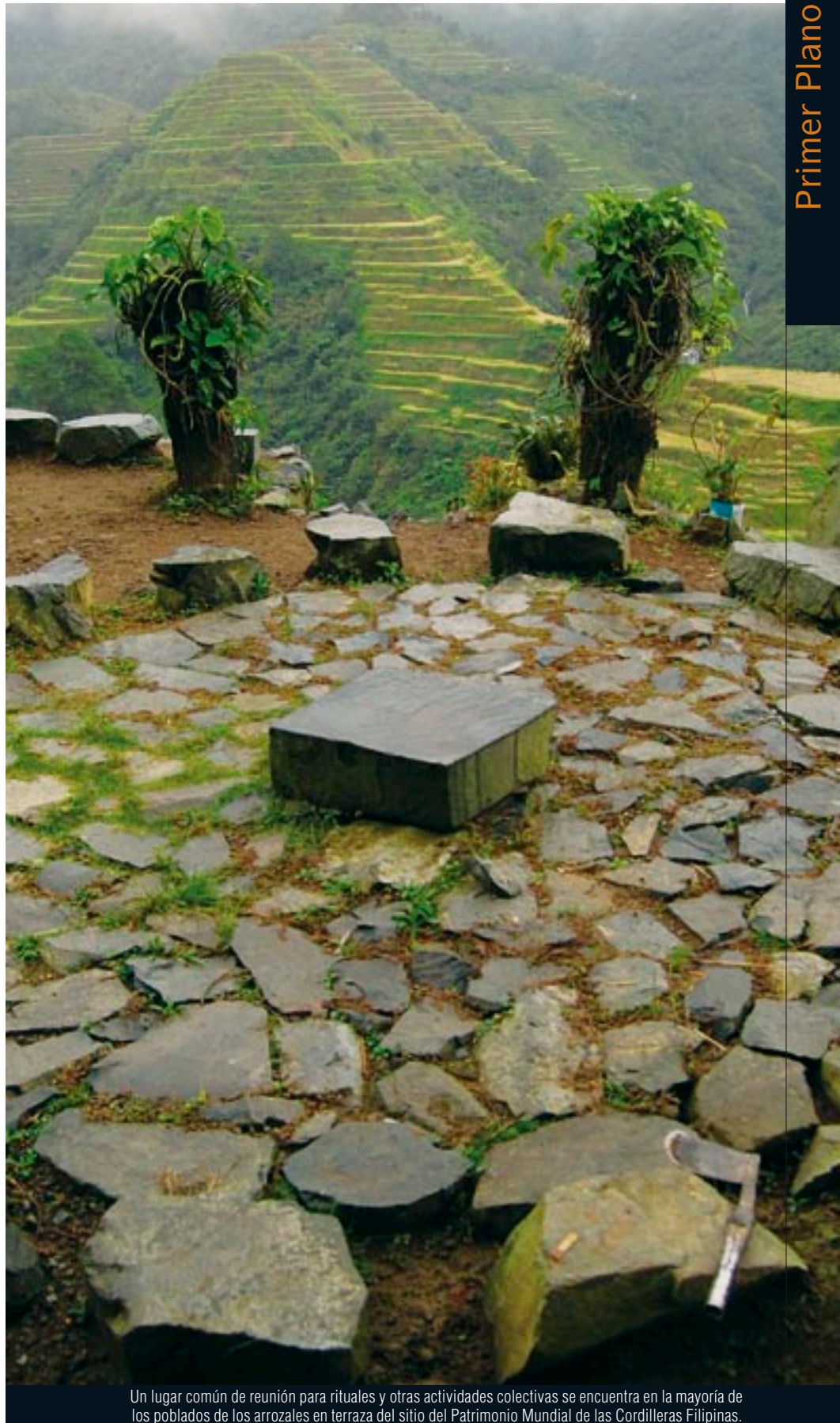
Un lugar común de reunión para rituales y otras actividades colectivas se encuentra en la mayoría de los poblados de los arrozales en terraza del sitio del Patrimonio Mundial de las Cordilleras Filipinas.

Simultáneamente el programa el Hombre y la Biosfera (MAB) buscaba, a partir de las ciencias naturales y sociales, promover