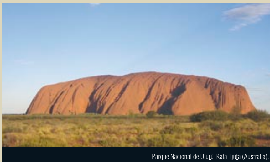
Parque Nacional de Ulurú-Kata Tjuṯa (Australia).

Los sitios del Patrimonio Mundial de la UNESCO del Parque Nacional de Ulurú-Kata Tjuṯa en Australia (Reserva de Biosfera Ayers Rock-Mount Olga) y el Parque Nacional/ Selva Natural del Monte Kenya son destacados sitios naturales sagrados. También se hallan otros sitios sagrados entre las Reservas de Biosfera de la UNESCO, como por ejemplo Bogd Khan Uul en Mongolia, Nilgiri en India y