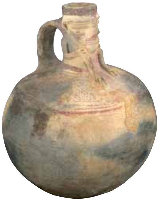
Jarra decorada con figura antropomorfa sentada con representación de pintura facial Muisca 600 - 1600 d.C. 21,5 x 17,3 cm. C13401