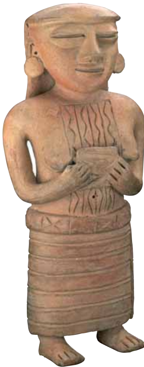
Figura antropomorfa femenina con representación de vestido, pintura corporal y adornos Zenú Tardío 900 - 1600 d.C. Ovejas, Sucre 27,0 x 11,8 cm. C12595

Entre ciertos grupos uitotos , la técnica de enrollamiento se pensaba como la conformación de una red de serpientes, lo cual genera un simbolismo de fuerte connotación sexual en la vasija de cerámica. Las serpientes de la vasija copulaban incluso con su propia dueña.