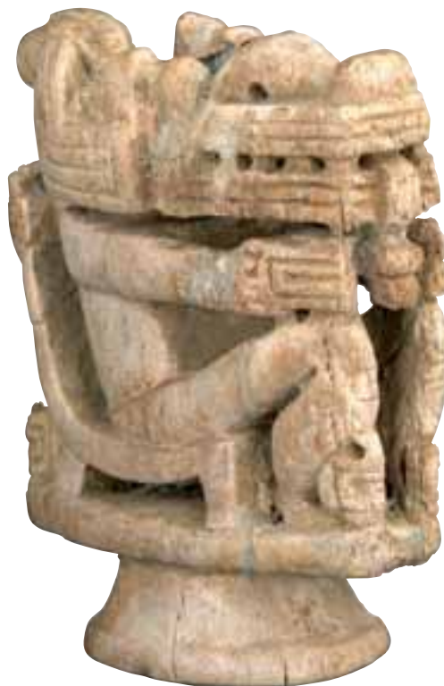
Remate de bastón en forma de hombre-lagarto sentado en banco, elaborado en hueso de mamífero Tairona Tardío 600 - 1600 d.C. 7,2 x 6,5 cm. H29

Los pueblos amerindios tuvieron, y aún poseen, una gran diversidad de usos y costumbres con relación a sus