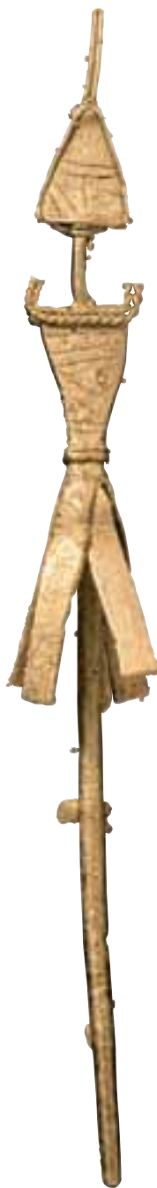
Figura votiva en forma de poste de sacrificio con adornos Muisca 600 - 1600 d.C. Fontibón D.C. Fundición a la cera perdida 10,0 x 1,2 cm. O30633

La relación entre el vencedor y el guerrero muerto o sacrificado era particularmente compleja. En ciertas sociedades, el sacrificador asumía la identidad de su cautivo sacrificado, se apropiaba de sus nombres y de sus poderes rituales. En algunos casos, la personalidad del vencedor experimentaba una verdadera metamorfosis. De acuerdo con algunas cosmologías contemporáneas, los hombres que participan en los rituales antropofágicos se asemejan a los “dioses caníbales”. De la misma forma que es indispensable que los hombres, a través del chamán, cacen los animales para que estos simbólicamente se multipliquen, los dioses caníbales permiten la reproducción de la sociedad. La identificación del guerrero con los dioses implicaba para éste asumir grandes riesgos