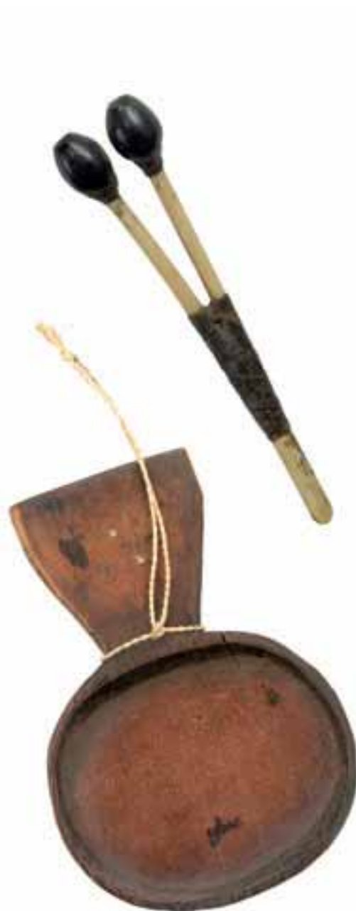
Bandeja para alucinógeno (yopo, Anadenanthera peregrina ) en madera e inhalador elaborado con huesos de ave y semilla Guahibo Llanos Orientales 12,8 x 8,8 cm. y 13,5 x 4,0 cm A154, A36

Como ha sido señalado por Reichel-Dolmatoff y otros autores, el arte de los indios del Amazonas y de otras regiones de Colombia tiene su inspiración en gran