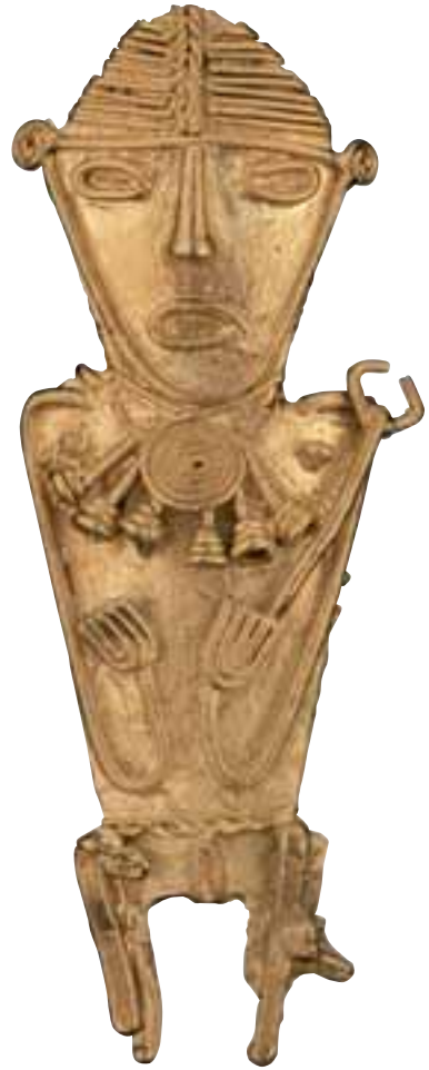
Figura votiva antropomorfa masculina sentada en banco Muisca 600 - 1600 d.C. Fundición a la cera perdida 7,9 cm. x 3,7 cm. O87