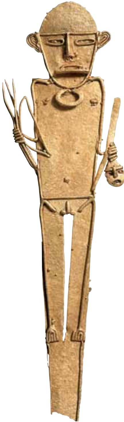
Figura votiva en forma de guerrero con arco, flechas y cabeza-trofeo Muisca 600 - 1600 d.C. Fundición a la cera perdida 11,9 x 3,2 cm. O296

Los muisca practicaron diversos tipos de sacrificios humanos. Las víctimas eran jóvenes que obtenían, a través de cadenas de intercambio— desde el Orinoco, al este de los Andes. La víctima, colocada en la parte superior de la gavia, al frente o a un costado del cercado, era muerta con flechas y dardos lanzados desde abajo; los sacerdotes recogían su sangre, con la cual llevaban a cabo diversas ceremonias rituales. Los cuerpos de los jóvenes sacrificados y otros hombres eran, en ciertos casos, dejados en las montañas para alimento del sol.