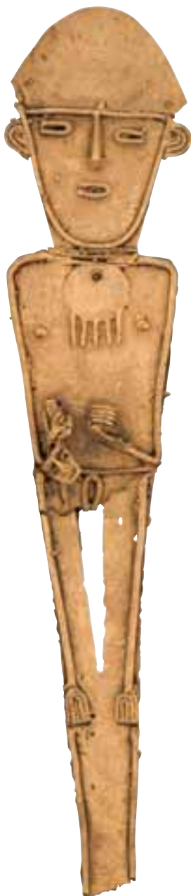
Figura votiva antropomorfa femenina con adornos Muisca 600 - 1600 d.C. Fundición a la cera perdida 13,0 x 2,7 cm. O1072

Figura votiva en forma de propulsor adornado con placas colgantes Muisca 600 - 1600 d.C. Fundición a la cera perdida 13,0 x 1,7 cm. O313