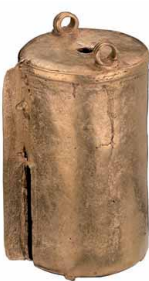
Colgante antropomorfo esquemático con tocado de plumería y el cuerpo encubierto por placas colgantes Calima Yotoco-Malagana 100 a.C. - 800 d.C. Restrepo, Valle del Cauca Fundición a la cera perdida 4,6 x 3,2 cm. O4562

La música tiene un rol fundamental en el baile. Los instrumentos rituales –flautas, cascabeles, maracas, tambores, bastones de baile– inducen cambios en la conciencia. La música contribuye a provocar visiones en las cuales se evocan colores y formas particulares, o propician la comunicación con los animales y la naturaleza. Los tambores convocan, en ciertas sociedades, a los animales de cacería.