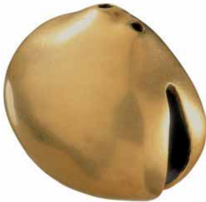
Cascabel semiglobular Nariño 400 - 1600 d.C. Ipiiales, Nariño Fundición a la cera perdida 3,4 x 4,0 cm. O30590

Colgante con la representación de un chamán con máscara bastones y adornos de plumería Quimbaya Temprano 0 - 600 d.C. Ansermanuevo, Valle del Cauca 7,0 x 7,0 cm. O3492