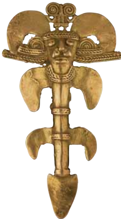
Colgante en forma de hombre-langosta con tocado bifurcado Zenú Temprano 150 a.C. - 900 d.C. Fundición a la cera perdida 9,8 x 5,5, cm. O22334

Los animales poseen también múltiples identidades, y pueden también