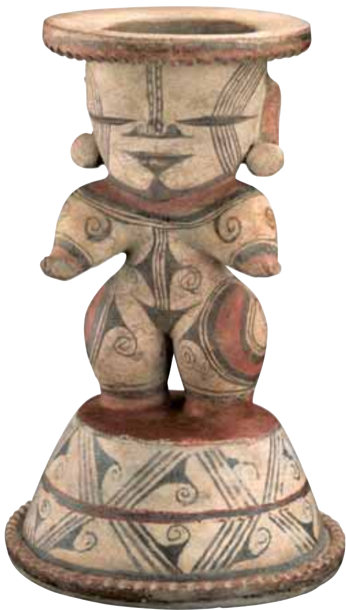
Figura antropomorfa femenina con representación de pintura facial y corporal muy elaborada Urabá 200 - 1600 d.C. 29,0 x 17,5 cm. C13238