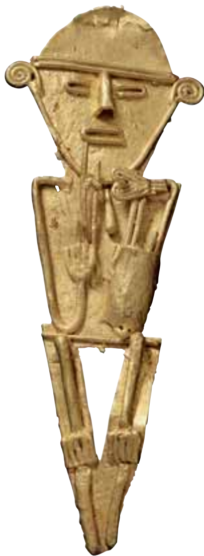
Figura votiva en forma de guerrero alaviado con adornos, portando escudo, dardos y propulsor Muisca 600 - 1600 d.C. Fundición a la cera perdida 11,6 x 6,1 cm. O3046