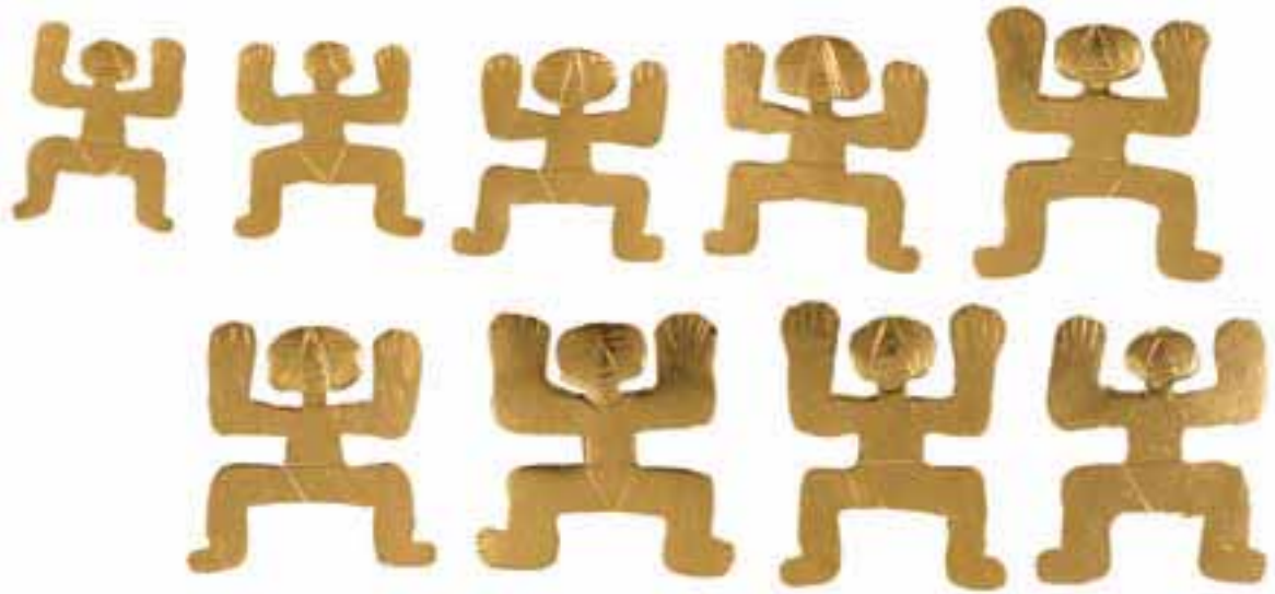
Colgante en forma de hombre-langosta Urabá 200 - 1600 d.C. Acandí-Chocó Fundición a la cera perdida 8,5 x 4,3 cm. O33381