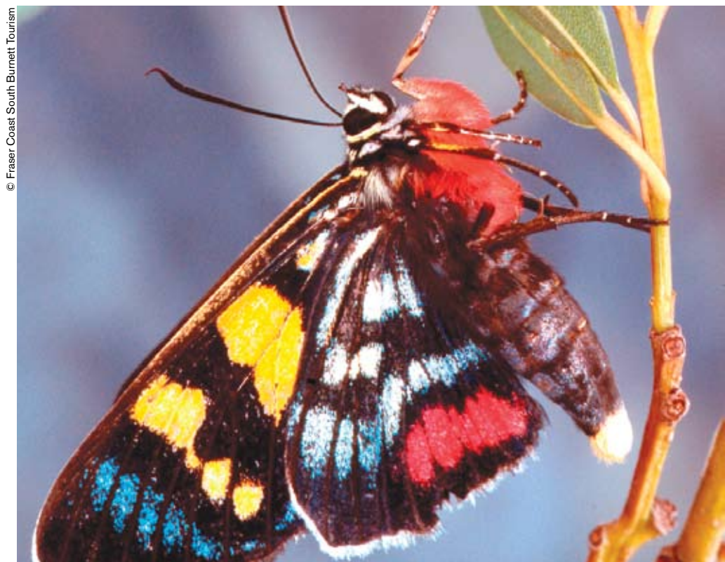
Fraser alberga especímenes raros de la fauna y flora australianas.