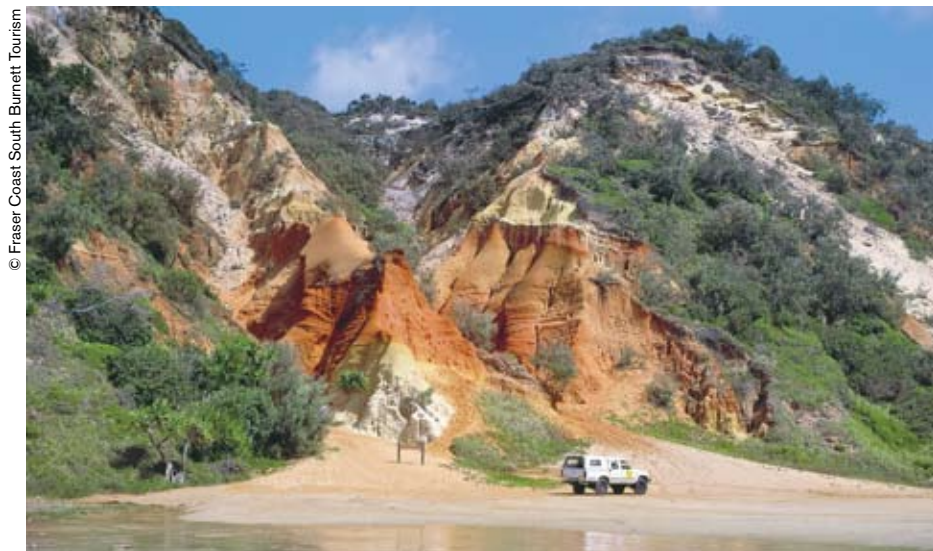
Para visitar la Isla Fraser es imprescindible tomar un barco o alquilar un vehículo con tracción a las cuatro ruedas.