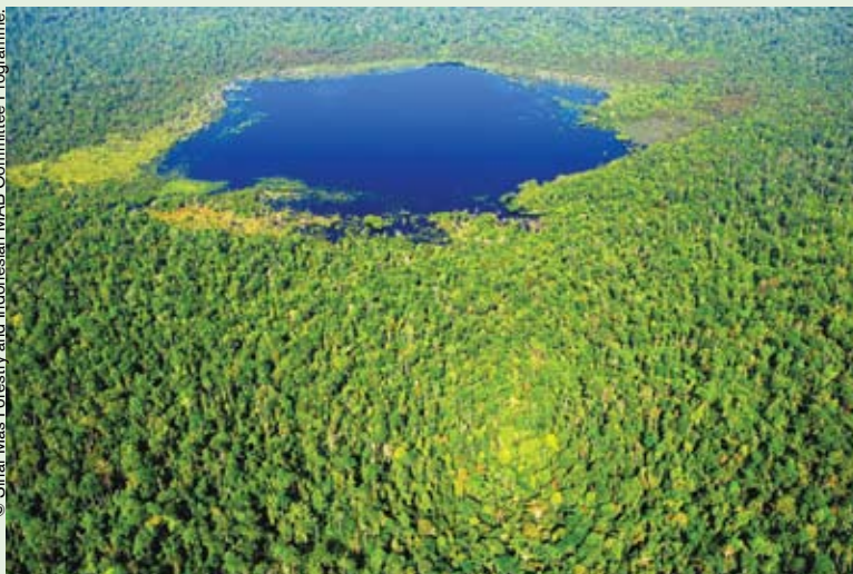
Turbera en la zona núcleo de la reserva de biosfera de Siam Giak Kecil – Bukit Batu.