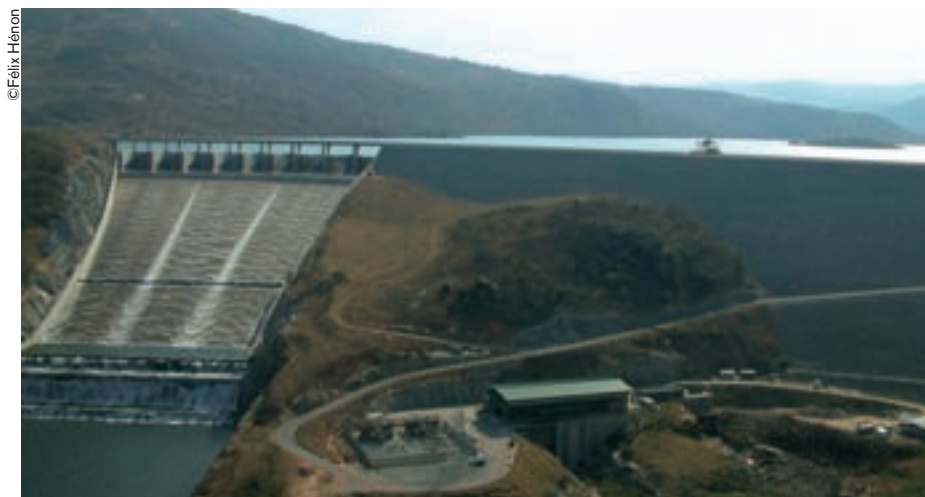
Una presa en Swazilandia.