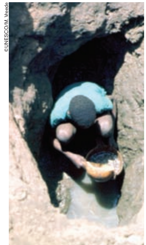
Hombre sacando agua con una escudilla (Kenya).